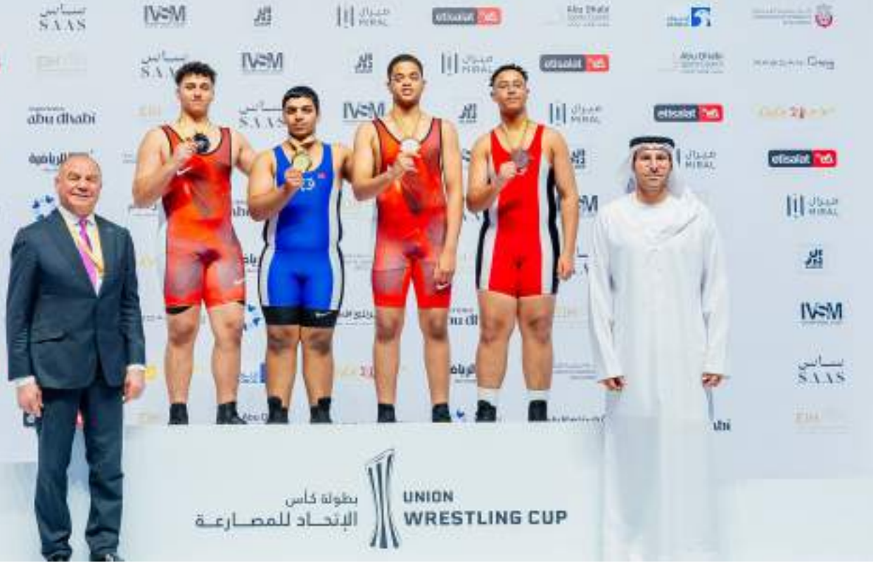
بطولة كأس الإتحاد للمصارعة