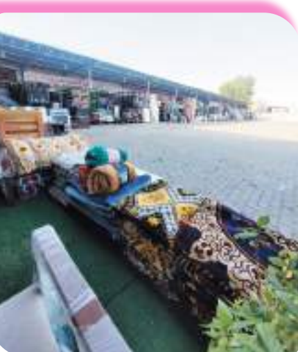
أسواق المقتنيات المنزلية في الوسط التجاري لدوار المدام

هذه المساكن المهجورة دفتها الرمال المتحركة.. ولاجن فيها ولا عفاريت