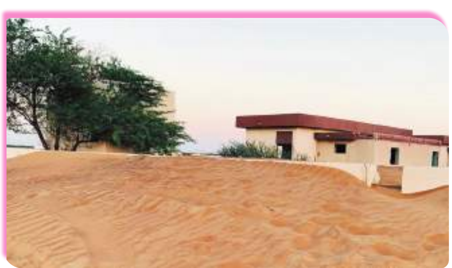
المساكن المهجورة من الأهالي بسبب التطور ومواكبة حداثة العمران دفتها الرمال المتحركة