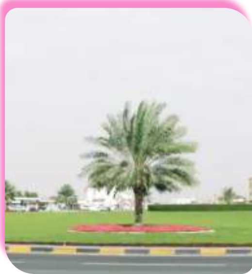
تسارع النمو الحضري لدوار المدام