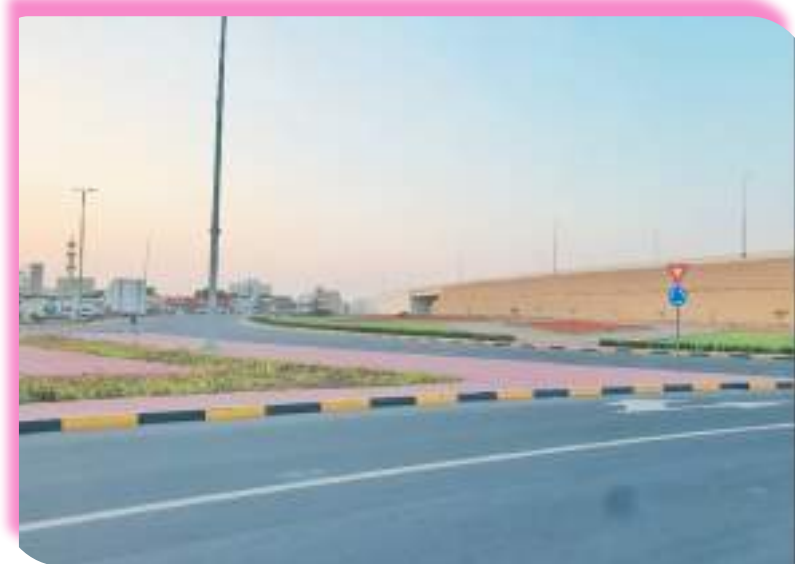
نظرة مستقبل زاهر لدوار المدام