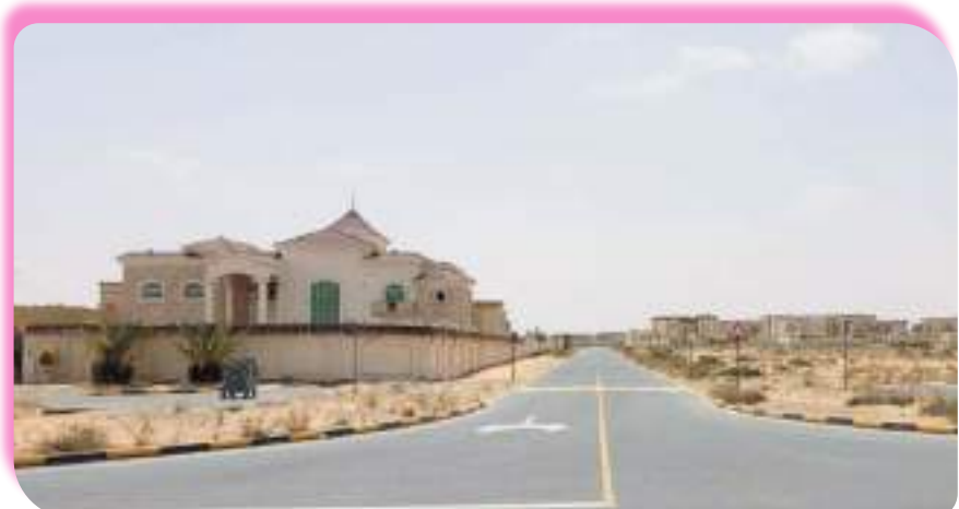
المنازل الحديثة في منطقة المدام