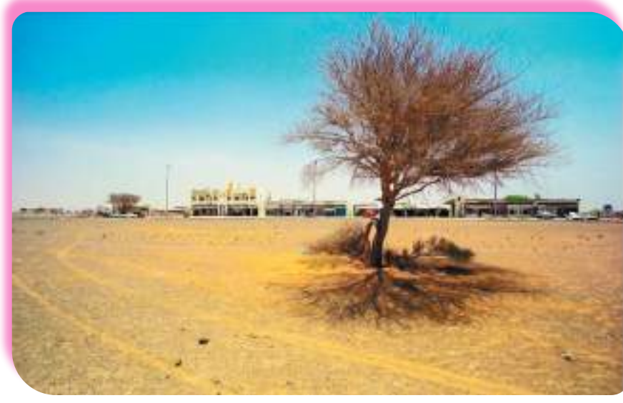
المدام بين الماضي والحاضر