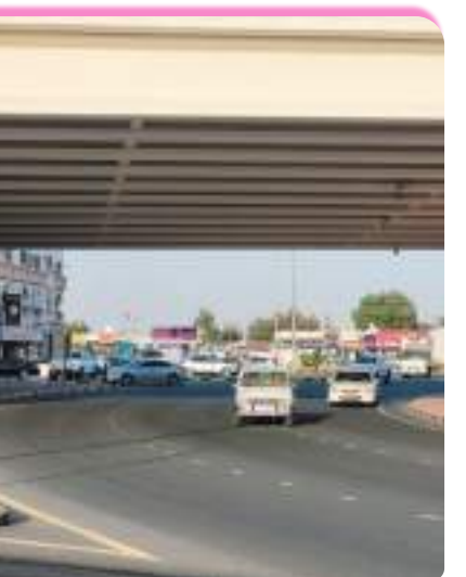
جسر دوار المدام والتطور التجاري