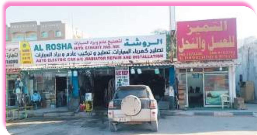
إحدى ورش إصلاح السيارات في دوار المدام

كافة الخدمات للسياح العرب والأجانب، من خلال مرشدين من أبناء المنطقة..ولهذا الشباب قصة طويلة مع المشاريع الاستثمارية في مجال السياحة، حيث يسعى حالياً لإطلاق مشروع الجديد المتمثل ببناء مطعم شعبي، يقابل تراثي إماراتي من حيث الشكل والخدمات، ويوفر للسياح مختلف جنسياتهم الأكلات الشعبية وتقديم فقرات من التراث الغنائي والموسيقي الشعبي.