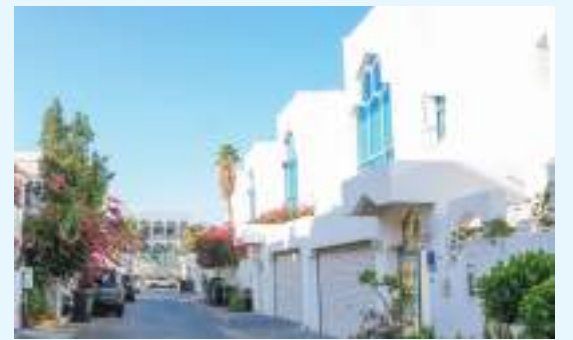
أبوظبي - الوحدة:

حرصاً على ترسيخ البيئة الصحية المثالية، وحماية المظهر العام من كافة أنواع المشوهات، وتعزيز دور المسؤولية المجتمعية للمشاركة في تحقيق هذه الأهداف وترسيخ الالتزام المجتمعي الذاتي بشأن رفع مستوى النظافة العامة في الأحياء السكنية، نفذت بلدية مدينة أبوظبي، من خلال مركز بلدية الشهامة، حملة لتنظيف السيكن والأشجار العشوائية في مدينة السمحة، بالتعاون مع شركة أبوظبي لإدارة النفايات (تدوير).