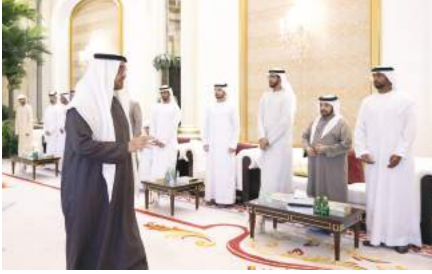
في وفاة مهرة بنت خالد آل نهيان

تقبل صاحب السمو الشيخ محمد بن زايد آل نهيان، رئيس الدولة، حفظه الله، يوم الثلاثاء، التعازي في وفاة الشخة مهرة بنت خالد بن سلطان آل نهيان.