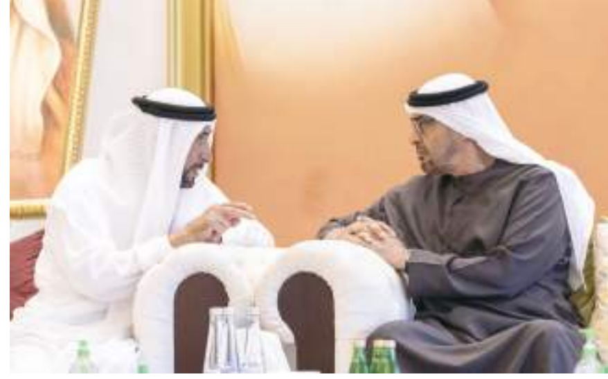
محمد بن زايد خلال تقبله التعازي

كما تقبل التعازي إلى جانب سموه، في مجلس العزاء في أبوظبي، الشيخ طحنون بن سعيد آل نهيان وعدد من الشيوخ. وأعرب الجميع عن خالص تعازيهم ومواساتهم إلى أسرة الفقيدة، داعين المولى عز وجل أن يتغمدها