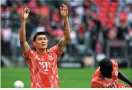
سيؤول - د ب أ

أعلن الاتحاد الكوري الجنوبي لكرة القدم، الثلاثاء، أن كيم مين جاي، مدافع بايرن ميونخ، تم اختياره كأفضل لاعب في العام بالبلاد. وساعد كيم، 27 عامًا، نابولي في التتويج بلقب الدوري الإيطالي للمرة الأولى في آخر 33 عامًا، العام الماضي، وتم اختياره أفضل مدافع في الكالتشيو. وانتقل كيم مين جاي إلى بايرن في آب/أغسطس الماضي مقابل 50 مليون يورو، وشارك حتى الآن في 22 مباراة وسجل هدفًا واحدًا. وسيمثل كيم، المنتخب الكوري الجنوبي في بطولة كأس آسيا التي تقام في قطر، حيث سيلعب المنتخب المتوج باللقب مرتين سابقتين، مع منتخبات ماليزيا والأردن والبحرين في دور المجموعات. ووصف الألماني يورجن كلينسمان، مدرب المنتخب الكوري الجنوبي، كيم بأنه "قائد مطلق للفريق". واعتمادًا على ما سيقدّمه منتخب كوريا الجنوبية في البطولة التي تقام في الفترة من 12 كانون الثاني/يناير الحالي إلى 10 شباط/فبراير المقبل، من الممكن أن يغيب كيم عن 6 مباريات بالدوري الألماني، بما في ذلك المباراة أمام باير ليفركوزن، متصدر جدول الدوري، والمقرر إقامتها يوم 10 شباط/فبراير المقبل.