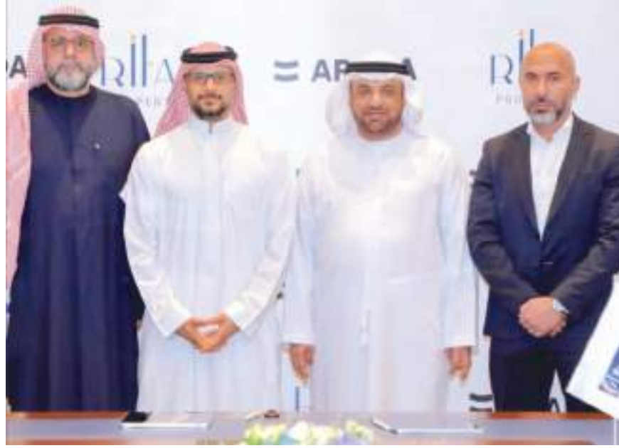
المساهمة بإثراء المشهد العقاري المتنامي والحيوي في هذه المدينة المزدهرة. من جانبه قال عبدالله قاسم: «شغوفون بدفع عجلة النمو في مدينة دبي ودعم المشاريع

أعلنت شركة «أراد» عن شراء قطعة أرض بمنطقة زعبل ٢ بقيمة 600 مليون درهم من شركة ريتال العقارية الذراع العقاري لبنك الإمارات دبي الوطني تبلغ مساحتها 138,466 قدماً مربعاً في موقع استراتيجي بين مركز دبي المالي العالمي ووسط مدينة دبي. ويخطط المطور العقاري للاستفادة من القطعة الجديدة عبر تشييد برج سكني فاخر من 50 طابقاً يضم 400 وحدة سكنية فاخرة. تم التوقيع على عقد شراء قطعة الأرض خلال حفل أقيم بهذه المناسبة في المقر الرئيسي لبنك الإمارات دبي الوطني في دبي بحضور صاحب السمو الملكي الأمير خالد بن الوليد بن طلال نائب رئيس مجلس إدارة أراد، وعبدالله قاسم رئيس مجلس إدارة شركة ريتال العقارية وأحمد الخسبيبي الرئيس التنفيذي للمجموعة في أراد وأحمد الشرياني الرئيس التنفيذي لشركة ريتال العقارية.