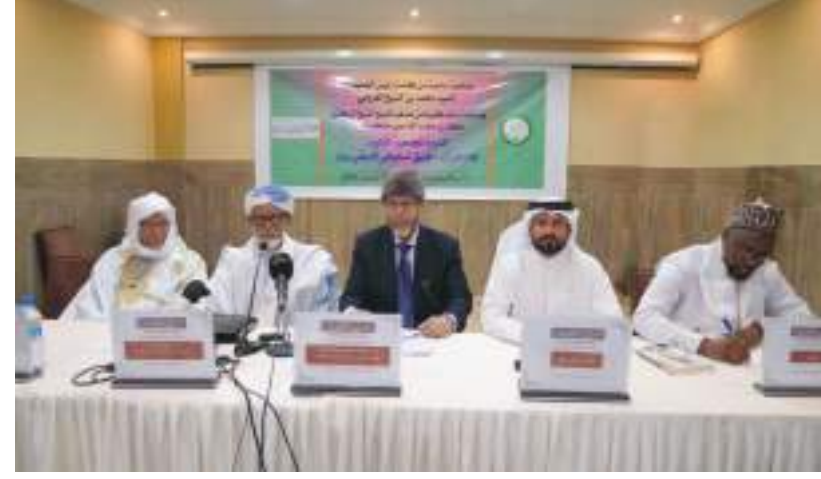
خلال فعاليات الندوة