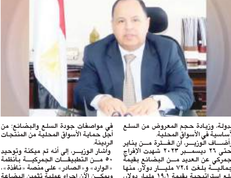
في مواصفات جودة السلع والبضائع: من أجل حماية الأسواق المحلية من المنتجات الرديئة.

وأشار الوزير، إلى أنه تم ميكنة وتوحيد ٥٠ من التطبيقات الجمركية بأنظمة «الوارد» و«الصادر» على منصة «نافذة»، ويمكن الآن إجراء عملية تكمين البضاعة من أي مركز لوجستي دون التقيد بمكان وجود البضاعة، لافتا إلى أنه تم السماح للمستوردين أو وكلائهم من المستخلصين الجمركيين باتخاذ إجراءات التخليص الجمركي المسبق عن البضائع التي يتم استيرادها من الخارج، وسداد نسبة ٢١ بدلا من ٢٣٠ من الضرائب والرسوم المقررة مبدئيا، قبل وصول البضاعة إلى الأراضي المصرية، وإجراء التسوية النهائية وسداد كامل الضرائب والرسوم المستحقة بعد وصول البضاعة، وفقا للتعريفات الجمركية وقت الإفراج.