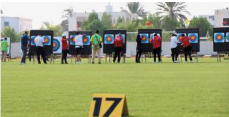
من البطولة الماضية

4 مراحل، وانطلقت المرحلة الأولى في نوفمبر الماضي، وتختتم في أبريل المقبل، وسيتم اختيار 4 لاعبين من كل فئة لخوض منافسة نهائية بعد نهاية المراحل الأربع.