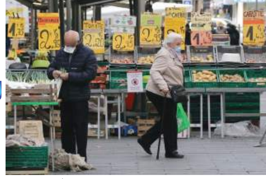
بروكسل - وكالات:

أعلن مكتب الإحصاء الأوروبي (يوروستات) أن التضخم ارتفع مجدداً في ديسمبر في منطقة اليورو إلى ٢,٩٪ على مدى عام واحد، بعدما سجل ٢,٤٪ في نوفمبر، ويرجع ذلك بشكل رئيسي إلى أسعار الطاقة.