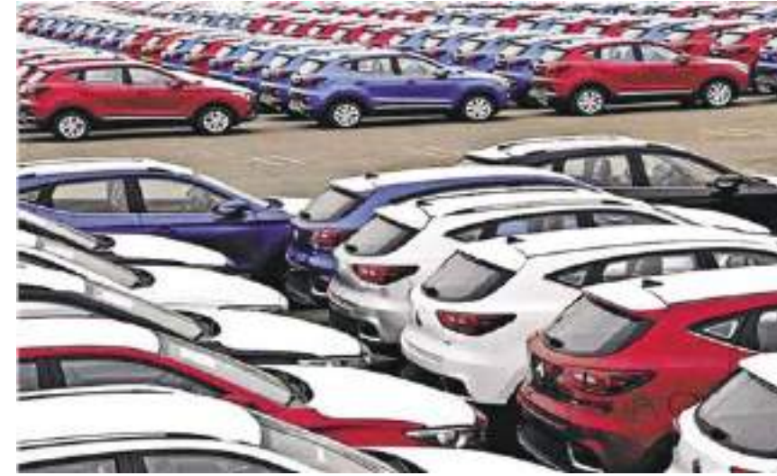
أنقرة - وكالات:

حققت تركيا في عام ٢٠٢٣ من أداء استثنائي في سوق السيارات، حيث وصلت مبيعات السيارات الركاب والمركبات التجارية الخفيفة إلى مستوى قياسي، وفقا للبيانات الصادرة عن رابطة موزعي السيارات والتنقل، ارتفعت المبيعات بنسبة ٥٧٪، وبلغ إجمالي عدد المركبات المباعة ١,٢٣ مليون مركبة.