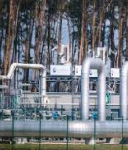
بروكسل - وكالات:

تراجعت واردات أوروبا من الغاز الطبيعي المسال من روسيا بصورة طفيفة العام الماضي بعد ارتفاع الكبير في ٢٠٢٢، وهو ما يعزز الدور المتنوع للاتحاد الأوروبي في مجال الطاقة. صنعت السياسة في بروكسل يعملون حاليا على مشروع قانون يسمح للدول الأعضاء بحظر الغاز الروسي بشكل كامل، سواء كان عبر الأنابيب أم الغاز الطبيعي المسال. تأتي هذه الخطوة بعد نحو عامين من بدء الحظر الروسية الأوكرانية، التي أثرت على الاعتماد الأوروبي على واردات الطاقة الروسية. يعتقد بعض المتداولين والمحللين أن هذا القانون قد يساهم في تخفيض تدريجي للواردات الطاقية دون تأثير كبير على سوق الغاز الأوروبي. رغم أن الغاز الطبيعي المسال من الولايات المتحدة قد سد الفجوة الناجمة عن تقليص واردات الغاز الروسي، إلا أنه أدى في الوقت نفسه إلى زيادة في واردات الغاز المشحون من روسيا، ووفقا لبيانات S&P GLOBAL COMMODITY INSIGHTS، كان الغاز الطبيعي المسال يشكل ١٣٪ من إجمالي إمدادات الاتحاد الأوروبي في العام الماضي.