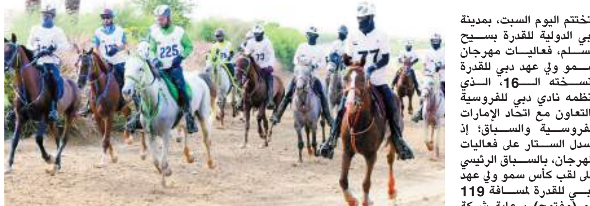
صورة إرشيفية من سباق العام الماضي

لنادي دبي للفروسية، أن سباق كأس سمو ولي عهد دبي للقدرة لمسافة 119 كم، يعتبر الحدث الأهم في مهرجان ويأتي ممسك ختام لفعالياته، كما يعد أحد أهم الأحداث في برنامج القدرة خلال الموسم. وقال: "يكتسب السباق أهمية كبرى نظراً لارتباطه باسم سمو الشيخ حمدان بن محمد بن راشد آل مكتوم، ولي عهد دبي، وهو من الأبطال البارزين في رياضة القدرة ومن أصحاب الإنجازات الكبيرة وأهمها فوزه بلقب العالم في نورماندي - فرنسا 2014".