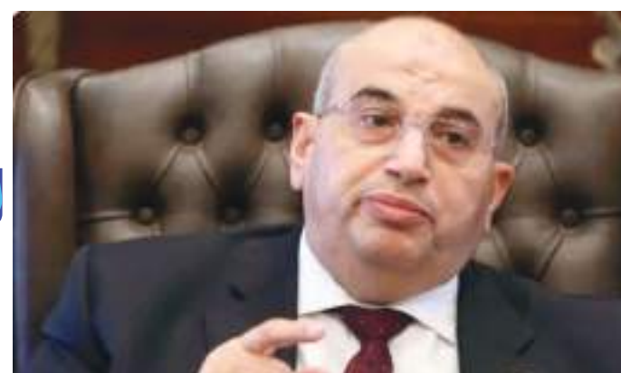
بروكسل - وكالات:

وقال إن الدولة حددت ١٥٢ فرصة استثمارية معظمها في قطاع مستلزمات