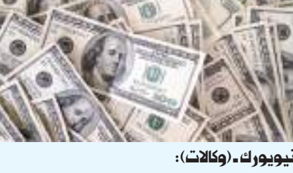
نيويورك - وكالات:

سجل الدولار يوم الجمعة، صعودا متجها نحو اقوى أداء أسبوعي له منذ شهر يوليو ٢٠٢٣، وسجل مؤشر الدولار ١٠٢,٣٩ في التعاملات المبكرة صباح أمس. وهبط الين ٠,٠٦٪ إلى ١٤٤,٧٢ للدولار، بعد أن لامس أدنى مستوى في أكثر من أسبوعين عند ١٤٤,٩٠ في وقت سابق من الجلسة بحسب رويترز وارتفع اليورو في أحدث تعاملات ٠,٠٩٪ إلى ١,٠٩٥٣ دولار، متجها لتسجيل انخفاض أسبوعي ٠,٨٪، منيها سلسلة مكاسب استمرت ثلاثة أسابيع. وبلغ الجنيه الاسترليني في أحدث تعاملات ١,٢٢٩٤ دولارا، مرتفعا ٠,١٢٪ خلال الجلسة، لكنه لا يزال يتجه نحو انخفاض طفيف بالنسبة للأسبوع.