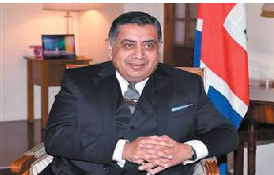
النسائية الذي تموله السفارة البريطانية لدى البلاد. وعن تطورات الأوضاع في المنطقة وما تشهده الأراضي الفلسطينية المحتلة من اعتداءات متواصلة من قوات الاحتلال الإسرائيلية أكد

وأشار اللورد أحمد إلى أن برنامج زيارته الحالية إلى الكويت يتضمن حضوره حفل تخريج أول دفعة من طالبات برنامج القيادة