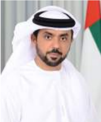
الشيخ حمدان بن زايد آل نهيان ممثل الحاكم في منطقة الظفرة.

أكد أحمد ثاني مرشد الرميثي. نائب رئيس مجلس إدارة نادي أبوظبي للرياضات البحرية. أن دعم القيادة الرشيدة للرياضة والرياضيين والموروث البحري. أسهم في خلق بيئة مميزة حافظت على هذا الإرث الوطني.