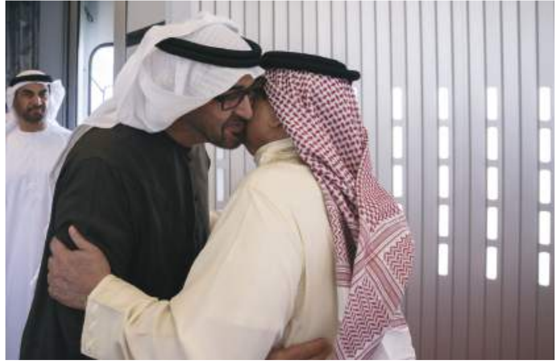
محمد بن زايد وحمد بن عيسى يزوران مقر قيادة الحرس الملكي في البحرين