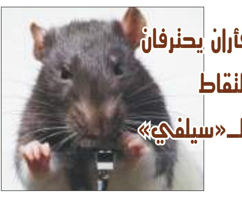
فأران يحزرفان النقاط «سيلفي»

بدأ فأران في التقاط صورهما الخاصة باستخدام كاميرا مثبتة داخل قفصهما، ابتكرها لهما الفنان أوغستين لينيهي. وقال لينيهي، إنه كجزء من دراساته العليا في عام 2021، قام بشراء فأرين من متجر للحيوانات الأليفة في فرنسا، حيث يعيش، وبنى قفصاً متقناً لهما، حسب «سي إن إن». وباستخدام آلية تعطي الفوارض السكر كلما ضغخت على زر، قام لينيهي بتدريبهما على التقاط صور لنفسيهما. وفي هذه العملية، أنتج تعليقا على مفاهيم المتعة، والكفاءة، والسلوكيات الإدمانية التي تسببها منصات التواصل الاجتماعي.