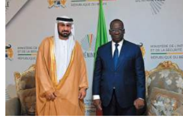
كوتونو - وام :

وأكد سعادته حرص دولة الإمارات على تعزيز التعاون المشترك والتنسيق وتبادل الخبرات في المجالات المختلفة بما يخدم مصالح البلدين الصديقين. من جانبه أشار معالي وزير الداخلية والأمن العام بجمهورية بنين إلى سعي بلاده إلى رفع مستويات التعاون مع دولة الإمارات إلى آفاق جديدة خاصة وأنها تعد نموذجاً رائداً يحتذى به في مختلف المجالات.