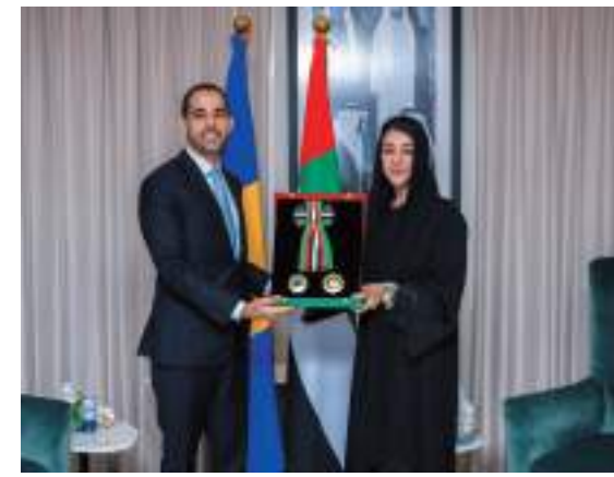
أبوظبي - وام :

منح صاحب السمو الشيخ محمد بن زايد آل نهيان رئيس الدولة "حفظه الله"، سعادة غابرييل عابد سفير جمهورية باربادوس، وسام الاستقلال من الدرجة الأولى، بمناسبة انتهاء فترة عمله سفيراً لبلاده لدى الدولة. وقلدت ريم بنت إبراهيم الهاشمي وزيرة دولة لشؤون التعاون الدولي، سعادته الوسام خلال اللقاء الذي عقد في مقر وزارة الخارجية، مؤكداً حرص دولة الإمارات على تعزيز العلاقات مع باربادوس في جميع المجالات. وأعربت معاليها عن تمنياتها لسعادة السفير بالتوفيق والنجاح في عمله، مثنية على دوره خلال فترة عمله في تعزيز العلاقات المتميزة بين دولة الإمارات وجمهورية باربادوس. من جانبه، أعرب سعادته عن بالغ شكره وتقديره لصاحب السمو الشيخ محمد بن زايد آل نهيان رئيس الدولة "حفظه الله"، مشيداً بمستوى التقدم الذي شهدته علاقات البلدين. وتقدم بالشكر إلى جميع الجهات، لما وجده من تعاون كان له الأثر الإيجابي في نجاح مهمته في الدولة.