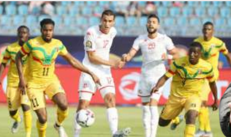
أبيدجان (د ب أ)-

يتسلح منتخب كوت ديفوار بالجماهير والتاريخ حينما يواجه منتخب مالي اليوم السبت، على استاد السلام، في دور الثمانية بطولة كأس أمم أفريقيا لكرة القدم، التي تنتهي فعاليتها يوم 11 شباط/فبراير الجاري. ويسعى المنتخبان لحجز تذكرة العبور للدور قبل النهائي حيث سيلتقي الفائز من هذه المباراة مع الفائز من مباراة دور الثمانية التي تجمع بين الكونغو