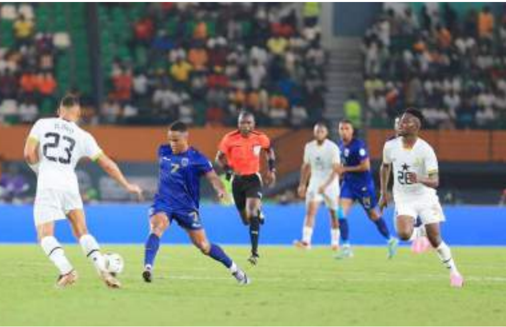
أبيدجان (د ب أ)-

يسعى منتخب الرأس الأخضر لمواصلة كتابة التاريخ في بطولة كأس أمم أفريقيا لكرة القدم، والتأهل للدور قبل النهائي، حينما يواجه منتخب جنوب أفريقيا اليوم السبت، على استاد شارليس كونان باتي، في دور الثمانية من البطولة. وحقق منتخب كاب فيردي (الرأس الأخضر) إنجازا كبيرا بتأهله لدور الثمانية للمرة الأولى في تاريخه، بعد إقامة البطولة بمشاركة 24 منتخبا حيث لم يسبق له من قبل أن تخطى دور الـ16 في مشاركته السابقة في البطولة، وفقا لهذا النظام. وسبق لمنتخب كاب فيردي المشاركة في ثلاث نسخ من قبل في كأس أمم أفريقيا، أعوام 2013 و2015 و2021، لكن تبقى مشاركته الأولى هي الأفضل حينما بلغ دور الثمانية عندما كانت