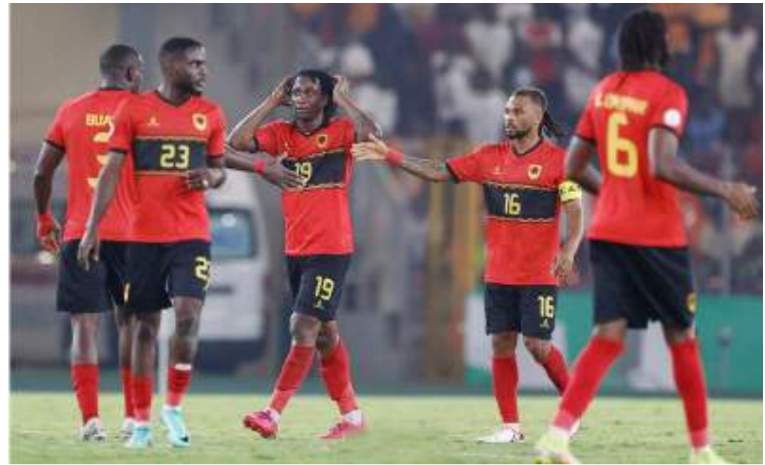
أبيدجان

فيما يغيب منتخب مصر عن ربع نهائي كأس أمم أفريقيا دون أي منتخب عربي لأول مرة منذ 2013، يتألق لاعب الاتحاد السكندري الأنجولي مابولولو وزميله لاعب الكرة القطري جليسون دالا بتسجيلهم الأهداف بغزارة، ضمن كتيبة لاعبين تنشط في الملاعب العربية لا تزال تحلم بالفوز بالبطولة. وأحرز الثنائي الأنجولي 7 أهداف (4 للدالا و3 لمابولولو) من 9 أحرزهم منتخب «الغزلان السوداء» الذي يأمل بتجاوز نيجيريا، بلوغ نصف النهائي الأول بتاريخه. ويواصل لاعب الأهلي المصري الجنوب أفريقي بيرسي تاو، أفضل لاعبي أفريقيا لعام 2023، التألق بعدما قاد منتخب بلاده «بافانا بافانسا» لإقصاء أبرز المرشحين (المغرب) من ثمن النهائي وبعدها أضاع ركلة جزاء في