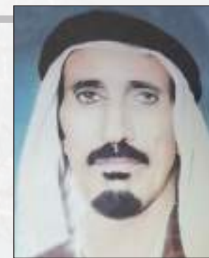
الشاعر سالم الجمري

تسعد بها ناس وناس تذلهم واللادمي ما يقدر ايجازيها والناس فيهم من غشيم وعارف حدا فهيم ونفسه أيجديها ما يعتنني فيما عناء ولاله ون خاض حيه حيتته يرفيها والبعض فيهم مستبد أبرايه يجني على نفسه وليحاتيها ويشوف نفسه مهتدي بالصايب وهو على ساس السرد أيبنيها يخوض في جهل غزير المايه ويشل حزمه قبل ليواسيها ومن شال حمل زايد عن حده يصعب عليه وحزمته يوطيها والحض فيها مثل ولم داير سفينت ملا اشراعك فيها ترجي ولو هي لاحمه من بونها ونجي على لحدود من عاليها ون باريك حظك غمر بشراعك هواك فالح والجزر ماتيها