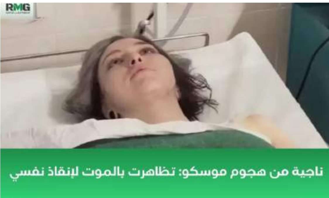
ناجية من هجوم موسكو: تظاهرت بالموت لإنقاذ نفسي

ووصف بوتين في خطاب موجه للشعب الروسي يوم السبت أن ما حدث في كروكوس هو هجوم إرهابي دموي وهمجي. وأضاف بوتين: «عشرات الأبرياء راحوا ضحية الهجوم الإرهابي في كروكوس. وأعرب عن تعازيه الصادقة