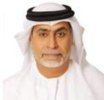
دبي - الوحدة:

أعلن اللواء «م» عبد الله السيد الهاشمي نائب رئيس اتحاد الإمارات للجولف عن التحضيرات الجادة والتي تبعث على التأهل لتمثيل منتخب الشباب والشابات للجولف في دورة الألعاب الخليجية الأولى للشباب 2024، والتي تقام منافساتها في مختلف إمارات الدولة، خلال الفترة من 16 أبريل إلى الثاني من مايو المقبلين. بمشاركة 3500 رياضي ورياضية وتقام تحت شعار «خليجنا واحد.. شبابنا واحد». وأكد اللواء الهاشمي أن توجيهات رئيس الاتحاد معالي الشيخ فاهم بن سلطان القاسمي وإخوانه مجلس الإدارة، ومتابعة معاليه لسير العمل وكافة متطلبات الاستضافة والتي تستهدف توفير كل متطلبات النجاح للمشاركين