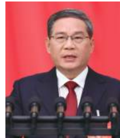
بكين - (وام):

أكد لي تشيانغ رئيس مجلس الدولة الصيني، أن الصين حددت هدفها من النمو الاقتصادي بنسبة حوالي 5 في المائة في عام 2024. وذكرت مجموعة الصين للإعلام، أن أهداف التنمية الرئيسية المتوقعة تحقيقها خلال هذا العام، تتضمن نمو إجمالي الناتج المحلي بمعدل 5٪، وتوفير فرص عمل جديدة لأكثر من 12 مليون شخص، وإبقاء نسبة البطالة في المدن والبلدات عند 5.5٪، وإبقاء معدل ارتفاع مؤشر أسعار المستهلك عند 3٪، والحفاظ على التوازن الأساسي في ميزان المدفوعات الدولية، وإبقاء حجم الإنتاج من الحبوب الغذائية عند أكثر من 650 مليون طن، وتخفيض استهلاك الطاقة للوحدة من إجمالي الناتج المحلي بقرابة 2.5 في المائة.