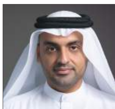
دبي - (وام):

وكشفت غرفة تجارة دبي، إحدى الغرف الثلاث العاملة تحت مظلة غرف دبي، عن تصدر أسواق دول مجلس التعاون الخليجي لوجهة صادرات وإعادة صادرات أعضائها إلى الأسواق العالمية خلال العام 2023، باستحوذها على 55.6٪ من إجمالي صادرات وإعادة صادرات الأعضاء، أي حوالي 158.1 مليار درهم، مما يعكس أهمية السوق الخليجية في تجارة أعضاء الغرفة. ووصلت قيمة صادرات وإعادة صادرات أعضاء غرفة تجارة دبي في العام 2023 إلى 284.5 مليار درهم. واحتلت أسواق القارة الأفريقية المرتبة الرابعة على قائمة وجهات صادرات وإعادة صادرات الأعضاء في العام 2023، باستحوذها على 7.9٪ من إجمالي صادرات وإعادة صادرات الأعضاء، بقيمة وصلت إلى 22.4 مليار درهم. وجاءت أسواق القارة الأوروبية في المرتبة الخامسة في هذه القائمة باستحوذها على 3.5٪ من إجمالي صادرات وإعادة صادرات الأعضاء، بقيمة وصلت إلى 10.1 مليار درهم.