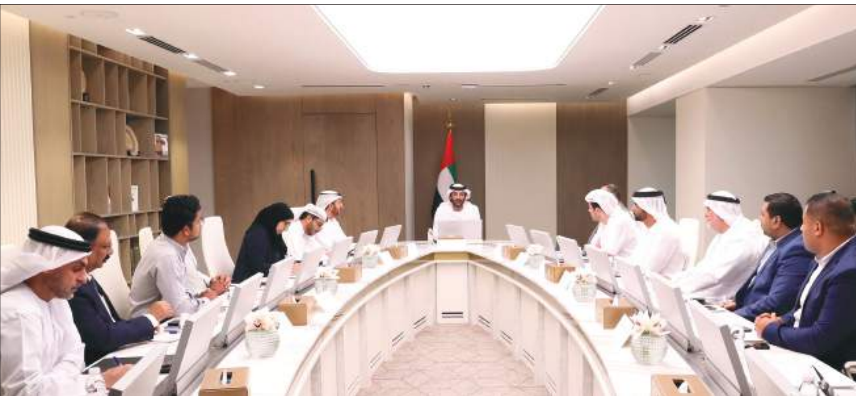
أبوظبي - (وام):

وقد يسهم في ترسيخ مكانة الإمارات كمركز عالمي رائد يوفر تجربة آمنة للمستهلكين ويضمن كافة حقوقهم، وبينه أعمال تنافسية للاستثمار في أنشطة تجارة الجملة والتجزئة، والتي حققت نمواً بنسبة 1٪ في الناتج المحلي الإجمالي للاقتصاد الوطني خلال النصف الأول من العام 2023، لتحل ضمن قائمة الأنشطة الأعلى نمواً. وقال معالي بن طوق: "يكتسب هذا الاجتماع أهمية خاصة كونه يأتي بالتزامن مع قرب حلول شهر رمضان المبارك، وخطوة مهمة للتأكيد على توافر السلع والمنتجات في أسواق الدولة بكميات وفيرة وكافية لفترات طويلة، لا سيما أن الوزارة حريصة على تلبية كافة احتياجات المستهلكين من السلع ودعم حصولهم عليها بسهولة ودون أي زيادات سعرية غير مبررة، إضافة إلى ترسيخ علاقة متوازنة بين الموردين والمستهلكين، وتحقيق مزيد من الاستقرار للسوق وتوفير مناخ استهلاكي آمن". واستعرض معاليه أبرز مخرجات المرسوم