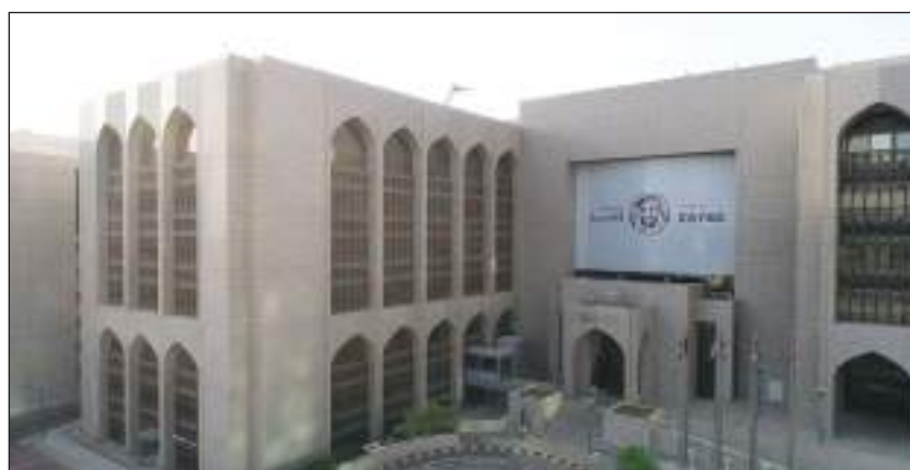
أبوظبي - (وام):

على أساس سنوي بنسبة 38٪ مقابل 493.88 مليار درهم خلال ديسمبر 2022، بزيادة تعادل نحو 187.3 مليار درهم خلال 12 شهراً. وأرجعت إحصائيات المصرف المركزي ارتفاعاً في حجم الأصول الأجنبية إلى زيادة الأرصدة المصرفية والودائع لدى البنوك بالخارج، على أساس سنوي بنسبة 41.3٪ إلى 443.43 مليار درهم في نهاية ديسمبر الماضي، مقابل نحو 313.81 مليار درهم في ديسمبر 2022. وسجلت الأوراق المالية الأجنبية ضمن الأصول الأجنبية للمصرف المركزي نحو 187.17 مليار درهم مع نهاية ديسمبر الماضي.