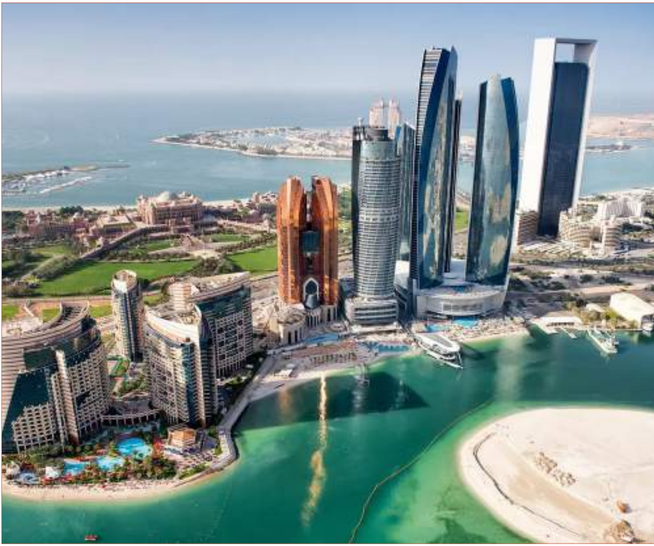
مشهد من العاصمة أبوظبي