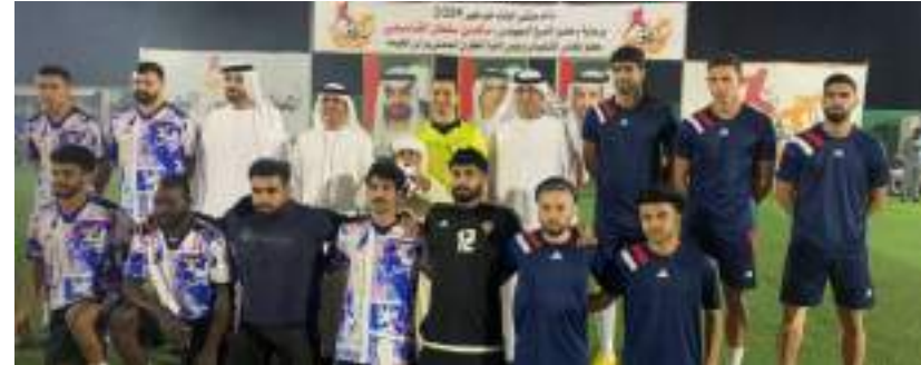
رأس الخيمة/ وام /

على فريق ون بيس بركلات الترجيح 3-2 بعد نهاية الوقت الأصلي 1-1 في لقاء أداره الحكم الدولي صقر الزعابي.