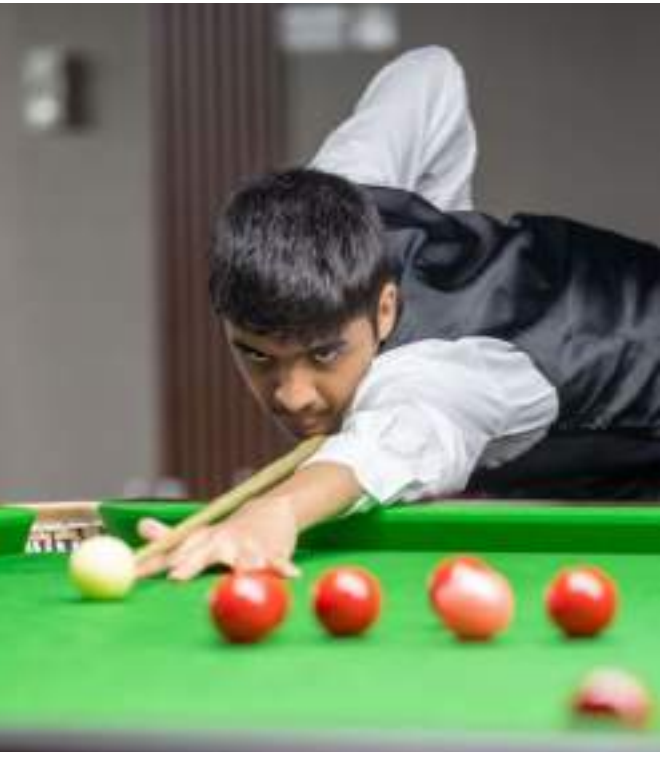
ديبي