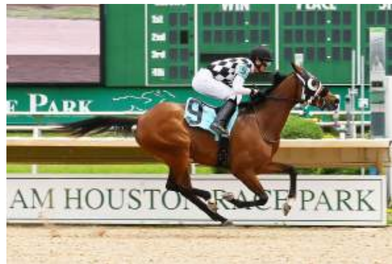
تكساس ( الوحدة)

«وما أطلس»، وسجلت البطلة زمناً وقدره 1:15:67 دقيقة، فيما جاءت في المركز الثالث المهرة «أي أي بيرنج داون».