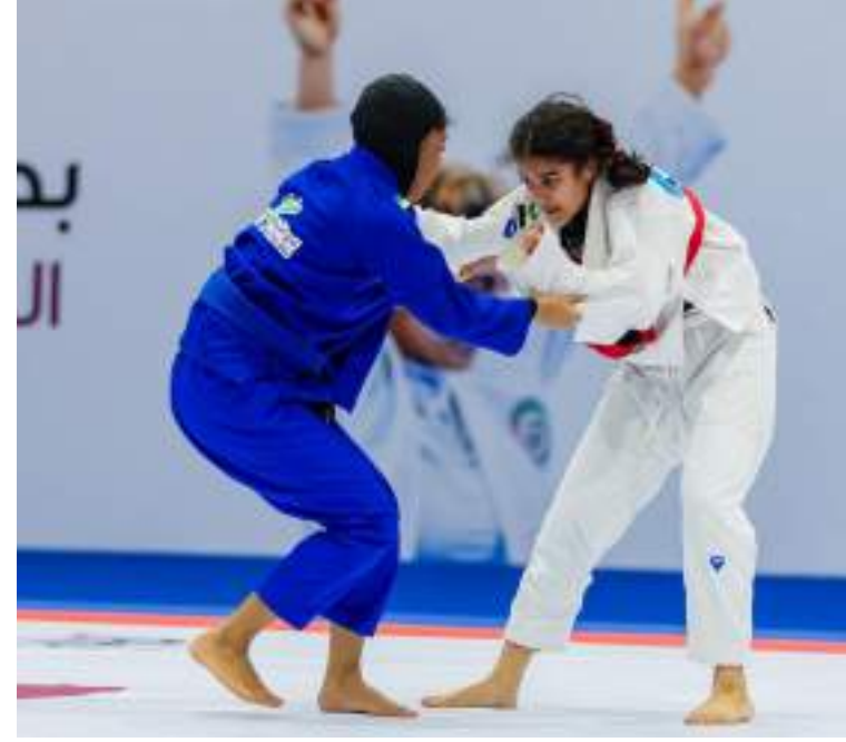
أبو ظبي - الوحدة:

توج معالي الدكتور ثاني بن أحمد الزيودي وزير دولة للتجارة الخارجية الأندية الفائزة ببطولة كأس «أم الإمارات» للجوجيتسو، التي اختتمت فعالياتها أمس في مدرسة مبارك بن محمد - الحلقة الثانية بأبوظبي. وشهدت البطولة التي استمرت على مدار يومين، نزالات قوية بين نخبة من لاعبي الجوجيتسو والمنصات قارياً وعالمياً وسط حضور جماهيري كبير. حضر جانباً من منافسات اليوم الختامي الشيخ زايد بن نهيان بن زايد آل نهيان، وسعادة عبد