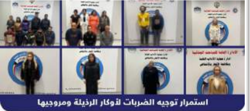
استمرار توجيه الضربات لـ 24 لوكار الرذيلة ومروجيها

السلبية المخالفة للأداب العامة، تمكنت الإدارة العامة للمباحث الجنائية ممثلة في إدارة حماية الآداب تمكنت من ضبط (24) شخصاً بتهمة الأعمال المنافية للآداب العامة في مختلف محافظات البلاد. كما تم ضبط عدد من المعاهد الصحية المخالفة وتم إحالتهم لجهات الاختصاص لاتخاذ كافة الإجراءات القانونية بحقهم. ونشرت وزارة الداخلية الكويتية صوراً لـ 24 شخصاً المضبوطين «مموهة» في تديونة على صفحتها بمنصة أكس (تويتر سابقاً) قائلة في بيان: «استمراراً لرصد ومتابعة كافة الظواهر