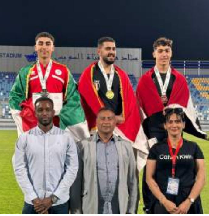
القاهرة