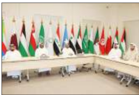
العمل البرلماني للأطفال.

ويتضمن برنامج الاستضافة مجموعة من الفعاليات والبرامج التي تهدف إلى مواصلة تأهيل الأطفال وتعزيز قدراتهم، فضلاً عن انعقاد الجلسة الرابعة من الدورة الثالثة للبرلمان العربي للطفل يوم 20 من يوليو الجاري، بمقر المجلس الاستشاري لإمارة الشارقة ما يعكس رؤية الإمارة وتوجهاتها صاحب السمو الشيخ الدكتور سلطان بن محمد القاسمي عضو المجلس الأعلى حاكم الشارقة في دعم وتعزيز