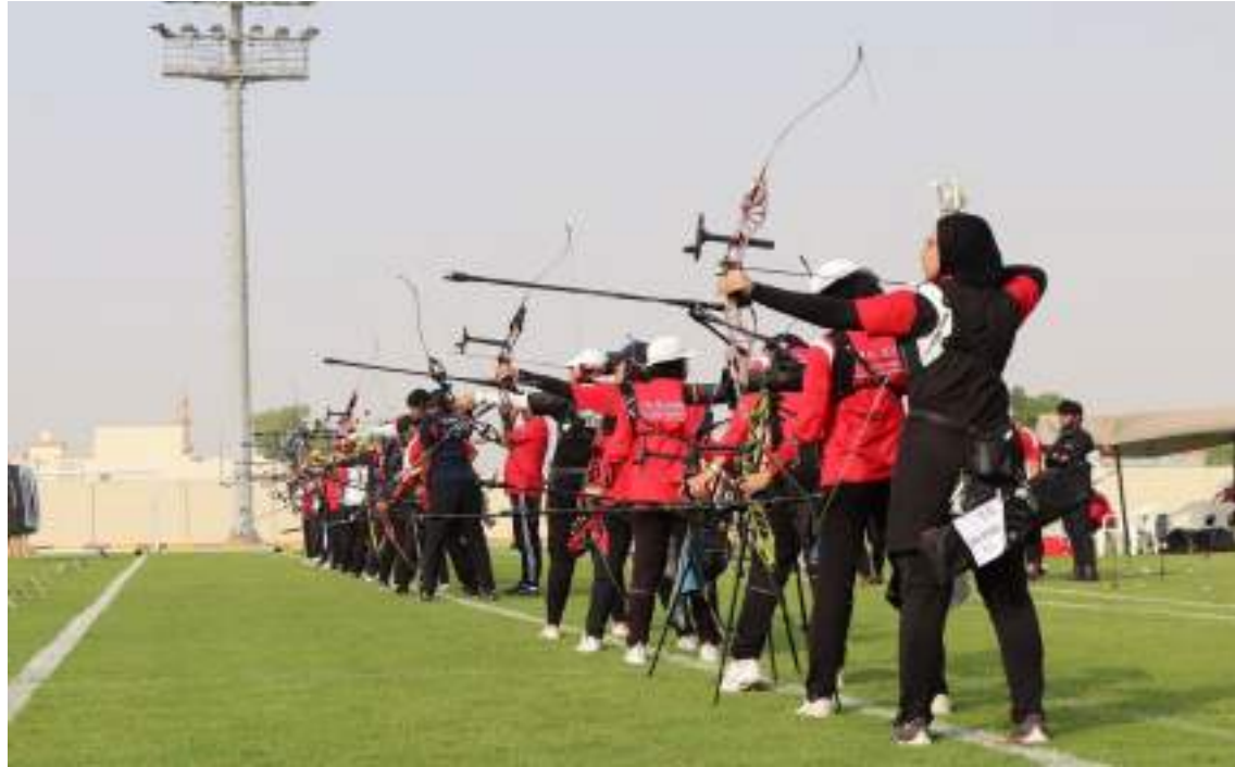
الشارقة / وام/

أعلن اتحاد الإمارات للقفوس والسهم، إقامة معسكر إعداد في أوزبكستان لـ 26 لاعبا ولاعبة على مرحلتين خلال شهري يوليو الجاري وأغسطس المقبل.