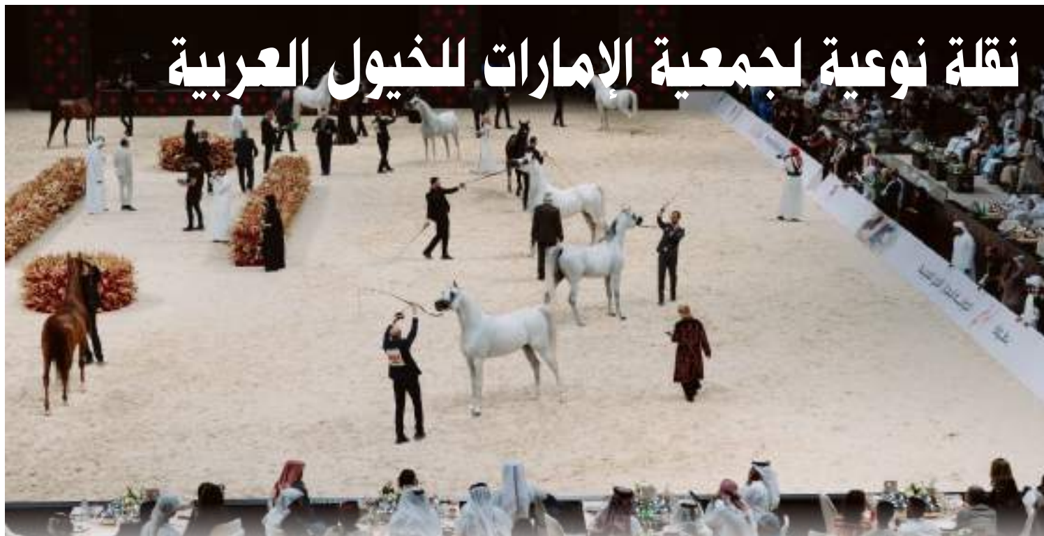
أبوظبي / وام/

وذكرت الجمعية أن القيمة الإجمالية للجوائز لبطولات الموسم الماضي، قد شهدت زيادة حيث وصلت إلى 42.283.000 درهم.