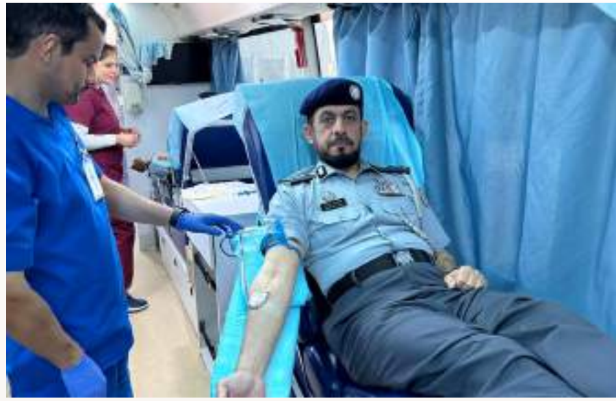
أبو ظبي وام:

نفتحت إدارة الخدمات الطبية وإدارة المراسم والعلاقات العامة في شرطة أبوظبي (يوم الاثنين) مبادرة «قطرة عطاء للتبرع بالدم» لتعزيز ثقافة التبرع التطوعي ودعم مخزون وحدات الدم بالتعاون مع بنك الدم -أبو ظبي التابع لشركة أبوظبي للخدمات الصحية (صحة)، وشارك في المبادرة اللواء خليفة محمد الخليلي مدير قطاع المالية والخدمات واللواء ثاني بطي الشامسي مدير أكاديمية سيف بن زايد للعلوم الشرطية والأمنية بشرطة أبو ظبي وعدد من الضباط وضباط الصف والأفراد والمدنيين وأشدات شرطة أبوظبي بالتعاون والشراكة مع شركة أبوظبي للخدمات الصحية (صحة) مؤكدة أهمية التبرع بالدم، والحرص على المشاركة في مختلف الفعاليات الصحية والطبية الداعمة لتعزيز جهودها في مجال التوعية بالبرامج العلاجية، وتقديم الخدمات الصحية للمتسربين، من ناحية أخرى افتتح العميد محمد البريك العامري مدير مديرية ترخيص السائقين والأليات في شرطة أبوظبي مكتب تقديم باقات الخدمات الاختيارية المميزة لتدريب وتأهيل السائقين وذلك بحضور خالد الشميلي الرئيس التنفيذي للإمارات لتعليم القيادة وعدد من الضباط، وأكد مدير مديرية ترخيص السائقين