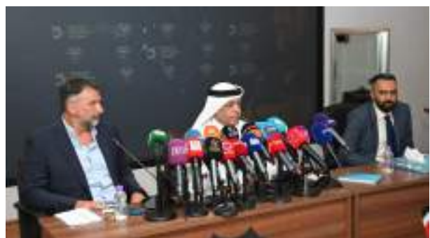
الكويت - (وكالات):

جدد مدرب منتخب الكويت الأول لكرة القدم، الأرجنتيني الأصل الإسباني خوان انطونيو بيتري، طلبه إقامة مباراة تجريبية للأزرق 30 الجاري في دبي، استعدادًا لخوض مواجهتي الأردن والعراق، المقرر لهما 5 و10 سبتمبر المقبل، في الجولتين الأولى والثانية من منافسات المجموعة الثانية، ضمن الدور النهائي لتصفيات كأس العالم 2026 بالولايات المتحدة وكندا والمكسيك، جاء ذلك خلال الاجتماع الذي عقده الإدارة الفنية بالاتحاد الكويتي لكرة القدم، مع بيتري ومساعدته، قبل المؤتمر الصحافي الذي عقده الاتحاد لتقديم الطاقم الفني للأزرق مساء الأحد الماضي. وأجرى مسؤولو الاتحاد اتصالات بالقائمين على عدد من الاتحادات الأهلية، من بينها الاتحاد البحريني، من أجل إقامة المباراة في التوقيت المذكور سلفًا، على أن يتم حسم أمر هذه التجربة اليوم أو غدا على أقصى تقدير، وتأكيدًا لما نشرته «الجريدة» فقد أعلن بيتري، في المؤتمر الصحافي، أن الإمارات سوف تستضيف معسكر الأزرق، والذي تقرر انطلاقه 24 الجاري، على أن يشن الفريق تدريباته هناك، وذلك عقب انتهاء الجولة الثالثة من منافسات دوري زين الممتاز، إلى ذلك، استقر بيتري على القائمة التي ستضم 26 لاعبًا.