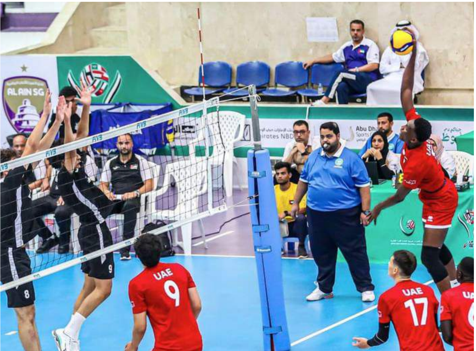
العين - (وام):

ورفع منتخب الإمارات، رصيده إلى 8 نقاط، وضمن تأهله إلى الدور ربع النهائي، بعد فوزه في 3 مباريات على منتخبات لبنان وفلسطين والأردن، وخسارة واحدة أمام المنتخب السعودي الذي حقق الفوز أيضا اليوم على نظيره الفلسطيني بنتيجة 3-0. وتصدر ترتيب المجموعة برصيد 9 نقاط. وضمن الجولة نفسها فاز منتخب الكويت على