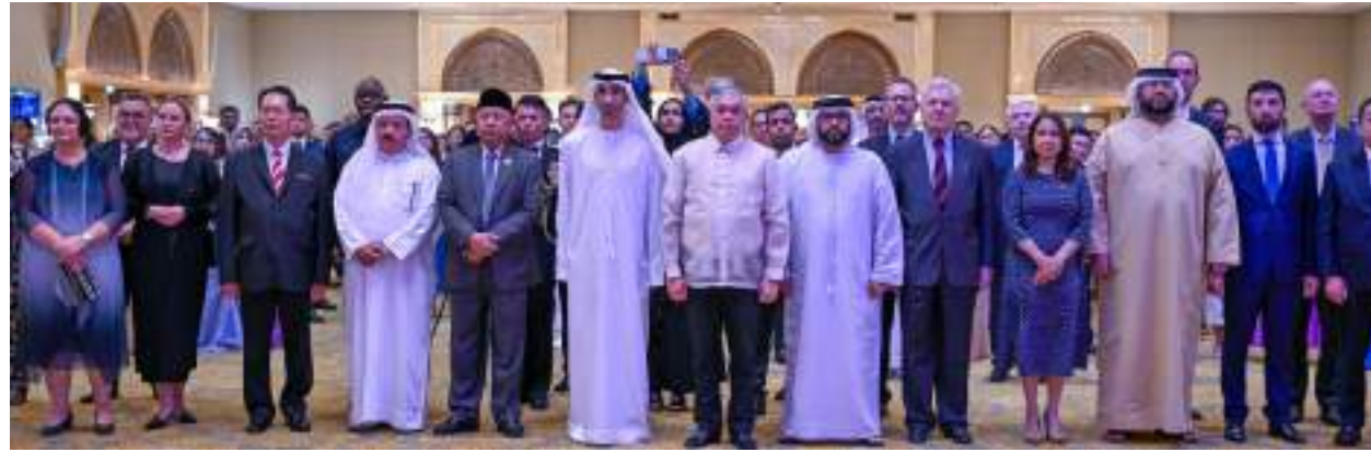
حضر معالي الدكتور ثاني بن أحمد الزيودي وزير دولة للتجارة الخارجية مساء يوم الثلاثاء حفل الاستقبال الذي أقامه سعادة الفونسو فرديناند سفير جمهورية الفلبين لدى الدولة بمناسبة اليوم الوطني لبلاده. وحضر الحفل - الذي أقيم في فندق قصر الإمارات (ماندرين أوريانتل) في أبوظبي - سعادة عبدالعزيز علي النيايدي مدير إدارة شروق آسيا والباسيفيك بوزارة الخارجية وعدد من كبار المسؤولين في الدولة ورؤساء البعثات الدبلوماسية