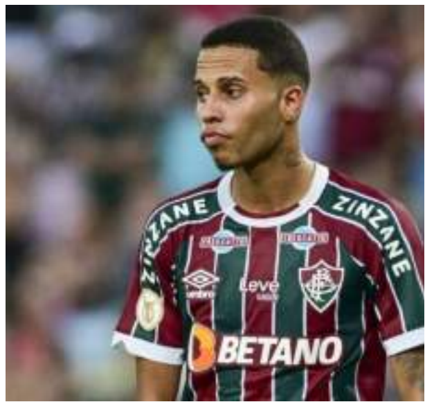
الرياض