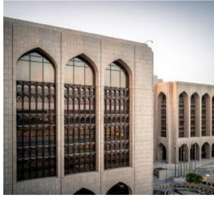
ومالكها وموظفيها، بالقوانين السارية في الدولة وأنظمة المصرف المركزي، بهدف الحفاظ

ويعمل مصرف الإمارات المركزي من خلال مهامه الرقابية والإشرافية على ضمان التزام جميع البنوك