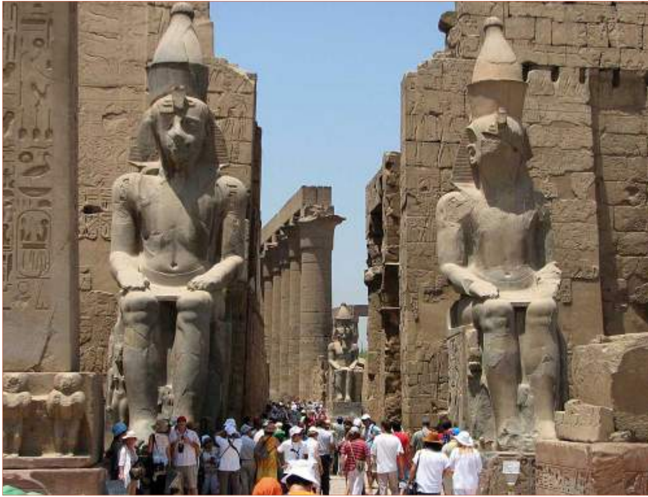
سياح وسط الآثار الفرعونية بالأقصر في صعيد مصر