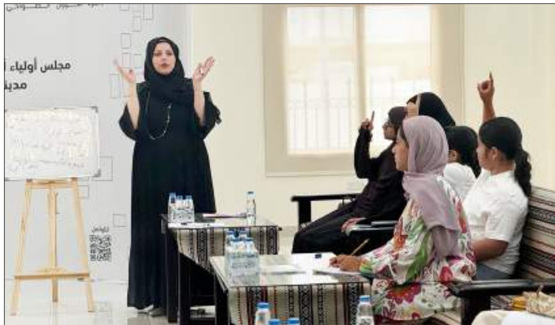
- بداية ناجحة

تأتي رعاية شوط «نخلة البيت» وتقديم جوائز عشرة فائزين لتلبية لمستهدفات صندوق الفرغان في ظل تكامل مساعي «دبي للربط» الهادفة إلى زيادة الروابط الاجتماعية بين جمهور المعرض ورمز من رموز التراث الوطني وهو النخلة، مع مستهدفات «صندوق الفرغان» الرامية إلى رعاية برامج ومشاريع ومعارض حفظ وتصور رموز التراث الوطني لدولة الإمارات وتعزيز الترابط الاجتماعي والاستقرار الأسري بين أحياء دبي. يحرض «صندوق الفرغان» على دعم ورعاية الفعاليات والمبادرات التي تساهم في تعزيز الهوية الوطنية وتشجيع على المشاركة المجتمعية وترسخ الاستقرار العائلي.