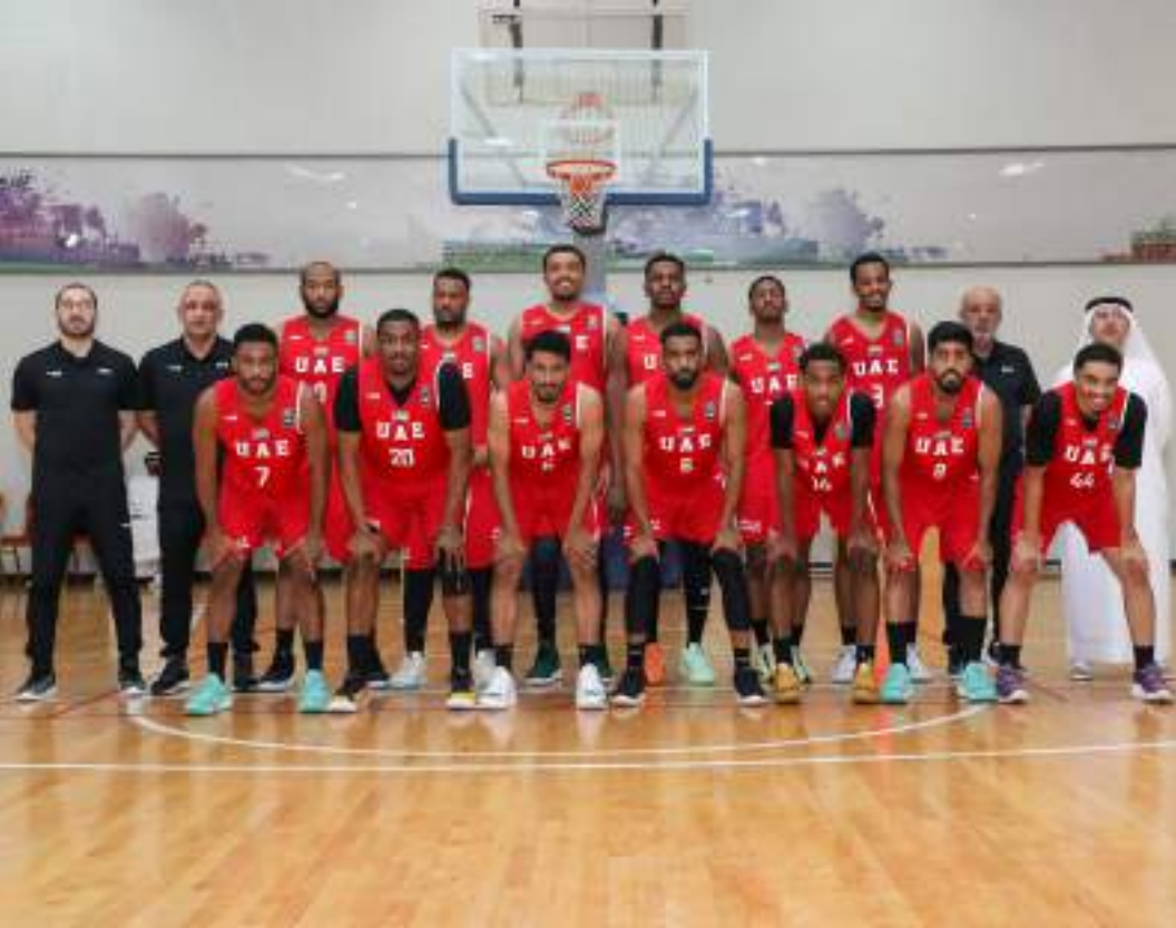
الظفرة - (وام):