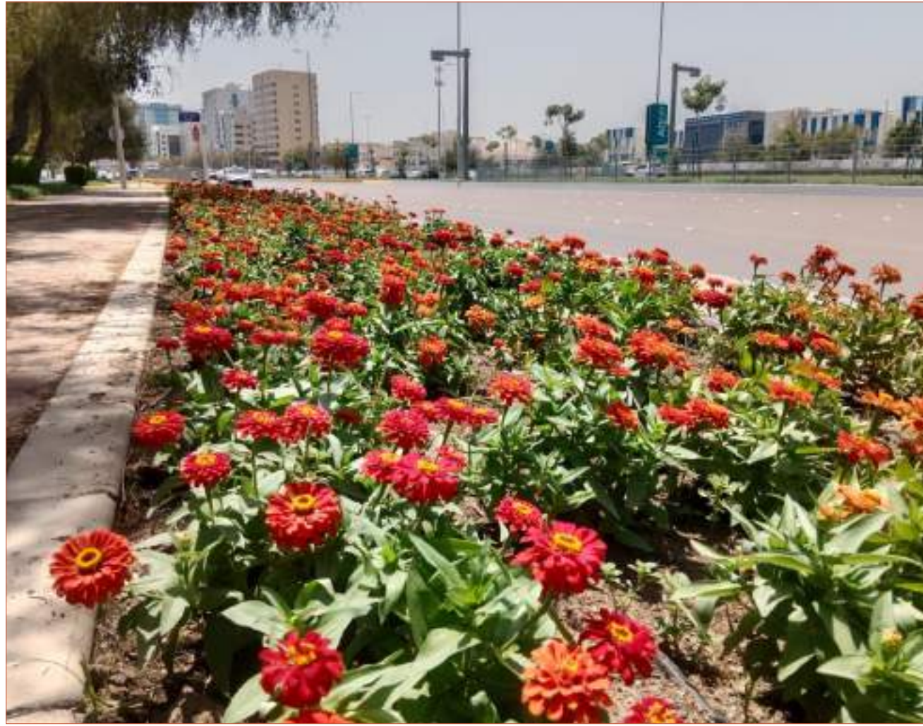
بلدية أبوظبي تنجز زراعة 6 ملايين زهرة للموسم الصيفي

للاستفسارات العامة info@alwahdanews.ae الموقع الإلكتروني www.alwahdanews.ae