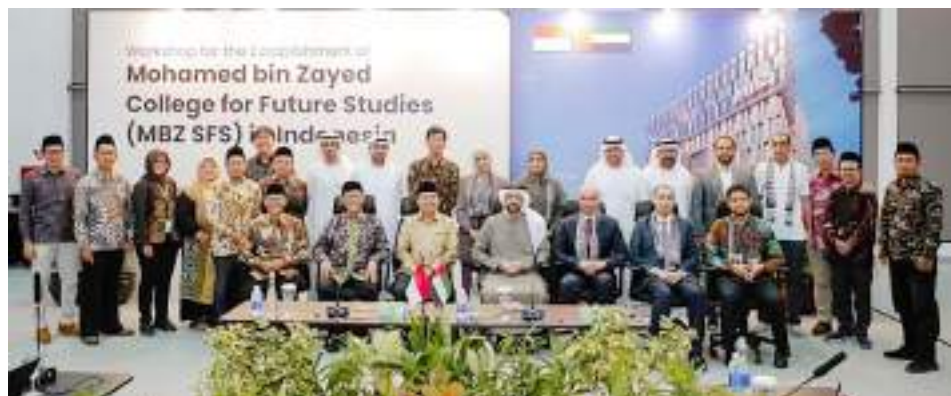
بوجياكارتا - إندونيسيا- وام:

نظمت جامعة محمد بن زايد للعلوم الإنسانية ورشة عمل بالتعاون مع جامعة نهضة العلماء في إندونيسيا، في إطار جهود تطوير البرامج الأكاديمية وتعزيز الشراكات الخارجية.