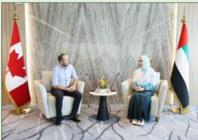
أبو ظبي- وام:

التقت سعادة سارة محمد فلكناز عضو المجلس الوطني الاتحادي نائب رئيس مجموعة الشريعة البرلمانية الإماراتية في الاتحاد البرلماني الدولي، يوم الثلاثاء بمقر الأمانة العامة بدبي، سعادة نانائيل أرسكين سميث عضو مجلس العموم في اتحاد كندا عضو اللجنة التنفيذية في البرلمان الدولي بحضور سعادة شيخة سعيد الكعبي عضو المجلس الوطني الاتحادي.