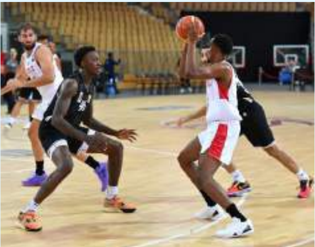
أبوظبي / وام /

شهدت مباريات اليوم الثاني من بطولة الوحدة الدولية لكرة السلة، فوز نادي الحكمة اللبناني على الفتح الريايطي المغربي 82-72، وفوز الاتحاد السكندري على الكويت الكويتي 108-104، والبشائر العماني على الوحدة 102-101، والكرخ العراقي على منتخب الإمارات 106-88.