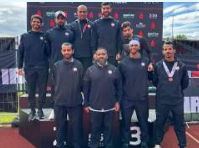
برلين في ٢٢ سبتمبر/وام /

فاز منتخب شرطة أبوظبي للترايثلون، بالمركز الأول في الترتيب العام ببطولة برلين، محققا إنجازا جديدا، ضمن سجلات إنجازاته الرياضية.