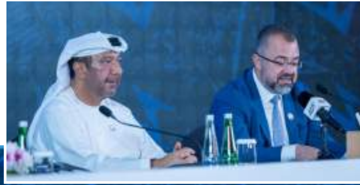
المؤتمر الصحفي لدوري بالمرز الرياضية للجوجيتسو المدرسي PALMS SPORTS SCHOOL JIU-JITSU LEAGUE PRESS CONFERENCE

وأشار إلى أن بالمرز الرياضية والتي تعد جزء من المنظومة الرياضية عملت على التعاون مع أبرز المؤسسات الحكومية لدعم ونشر ثقافة الجوجيتسو بين الطلاب والطالبات تأكيدًا لدورها المجتمعي في تأسيس جيل جديد محب لهذه الرياضة وله دور فعال فيها.