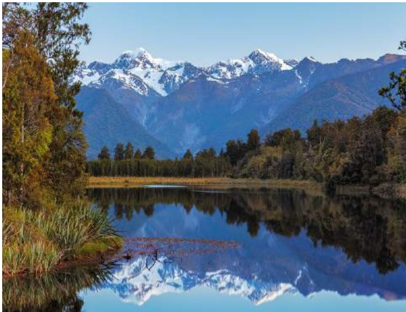
بحيرة ماثيسون بالساحل الغربي لنوريلندا