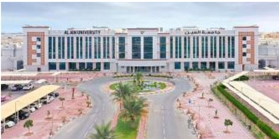
أبوظبي - وام:

تحت رعاية معالي الشيخ نهيان بن مبارك آل نهيان وزير التسامح والتعايش تنظم جامعة العين حفل تخرج الفوج الثامن عشر يوم 23 أكتوبر الجاري في قصر الإمارات أبوظبي للاحتفاء بدفعة جديدة من خريجها ضمن مختلف الكليات والبرامج الأكاديمية من درجات البكالوريوس والماجستير ودبلوم الدراسات العليا المهني في التدريس للفضلين الأول والثاني والوصول الصفيفة للعام الأكاديمي 2023-2024.