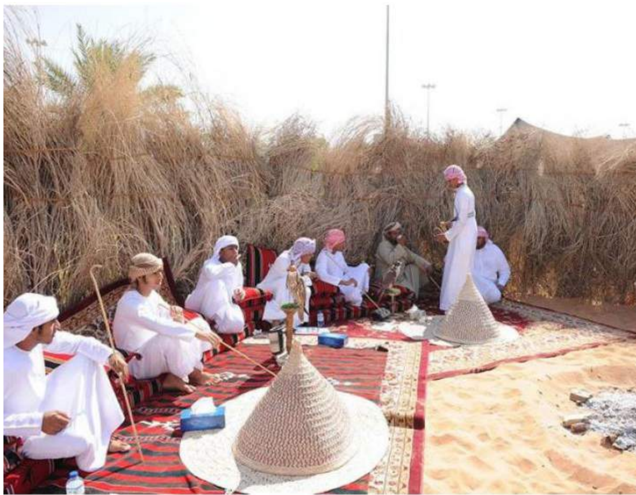
السنع في الامارات .. قيم وعادات تتوارث وتحافظ على الاصاله