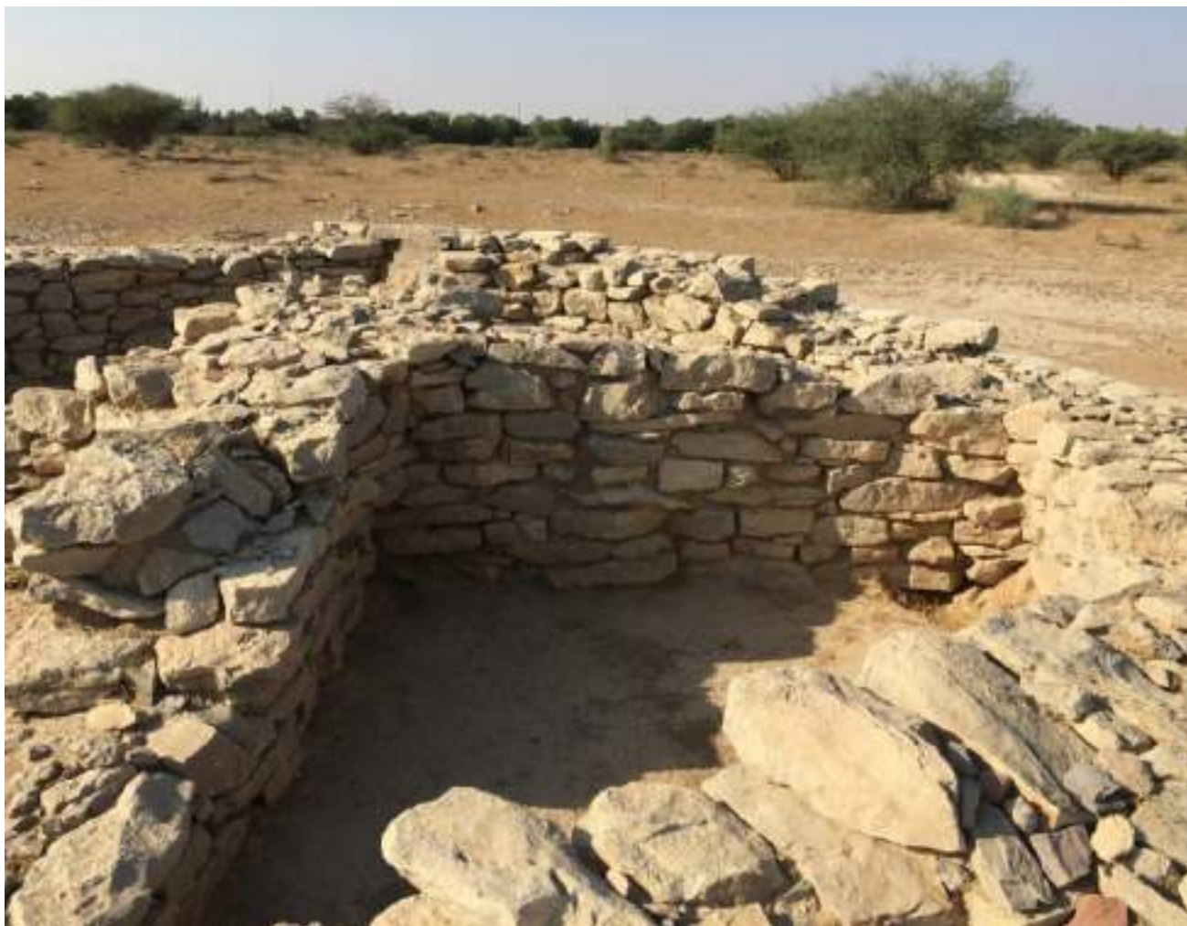
موقع «شمل» في رأس الخيمة يضم أكبر مجموعة من المدافن المغليثية في جنوب شرق شبه الجزيرة العربية والتي تعود إلى عصور ما قبل التاريخ