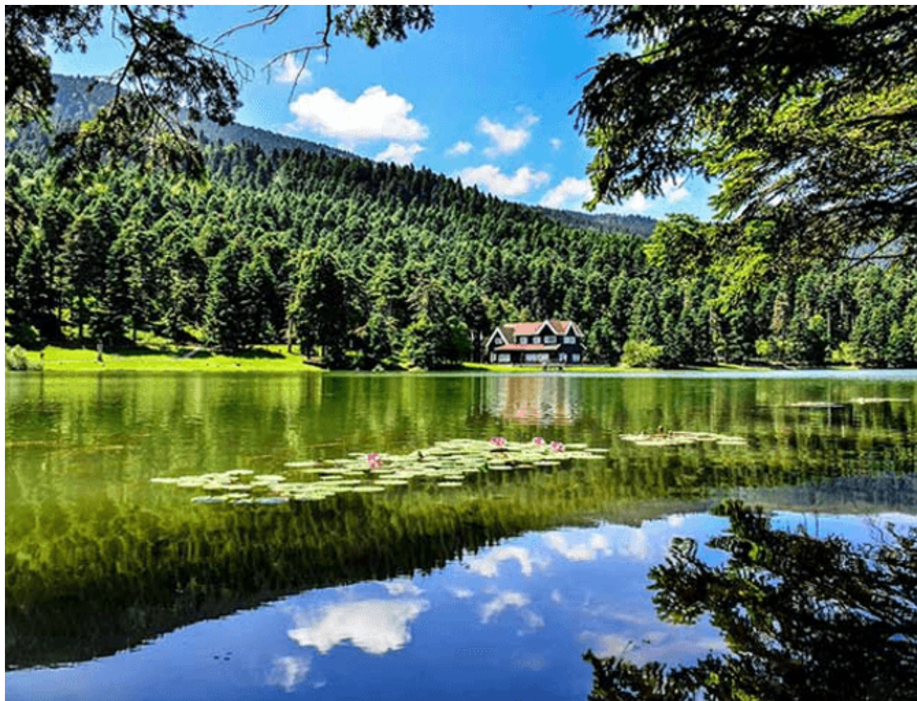
بحيرات تركيا .. وجهة سياحية للاسترخاء في الطبيعة

للاستفسارات العامة info@alwahdanews.ae الموقع الإلكتروني www.alwahdanews.ae