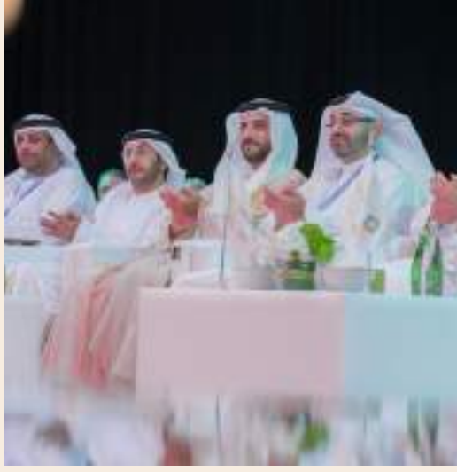
الشارقة - (وام):

شهد سمو الشيخ سلطان بن أحمد بن سلطان القاسمي نائب حاكم الشارقة، صباح يوم الاثنين انطلاق النسخة الحادية عشرة لمنتدى الشارقة الدولي للسياحة والسفر، تحت شعار «مستقبل السياحة: في مجالات الرقمنة، الصحة والسلامة»، والذي يقام بتنظيم من هيئة الإنماء التجاري والسياحي، وذلك في مركز أكسيو الشارقة. واستهل حفل الافتتاح بالسلام الوطني لدولة الإمارات العربية المتحدة، وشاهد سموه والحضور بعدها عرضاً مصوراً تناول أهداف المنتدى وأبرز ما ستتم مناقشته في الجلسات. حيث ألقى خالد جاسم المدفع رئيس هيئة الإنماء التجاري والسياحي، كلمة رحب فيها بسمو نائب حاكم الشارقة والحضور في المنتدى، الذي يجمع عدداً من الخبراء العالميين وقادة القطاع المبدعين وصناع القرار والسياسات، لمناقشات التوجهات المستقبلية في السياحة وكيفية الاستفادة من التقنيات الحديثة لتحسين تجربة السياح وتعزيز الاستفادة في القطاع. وأشار المدفع إلى الانتعاش الذي يشهده القطاع السياحي مؤخراً، حيث أن الدراسات تشير إلى أن عام 2024 سيسجل زيادة تقدر بنسبة 4-7% في المنطقة.