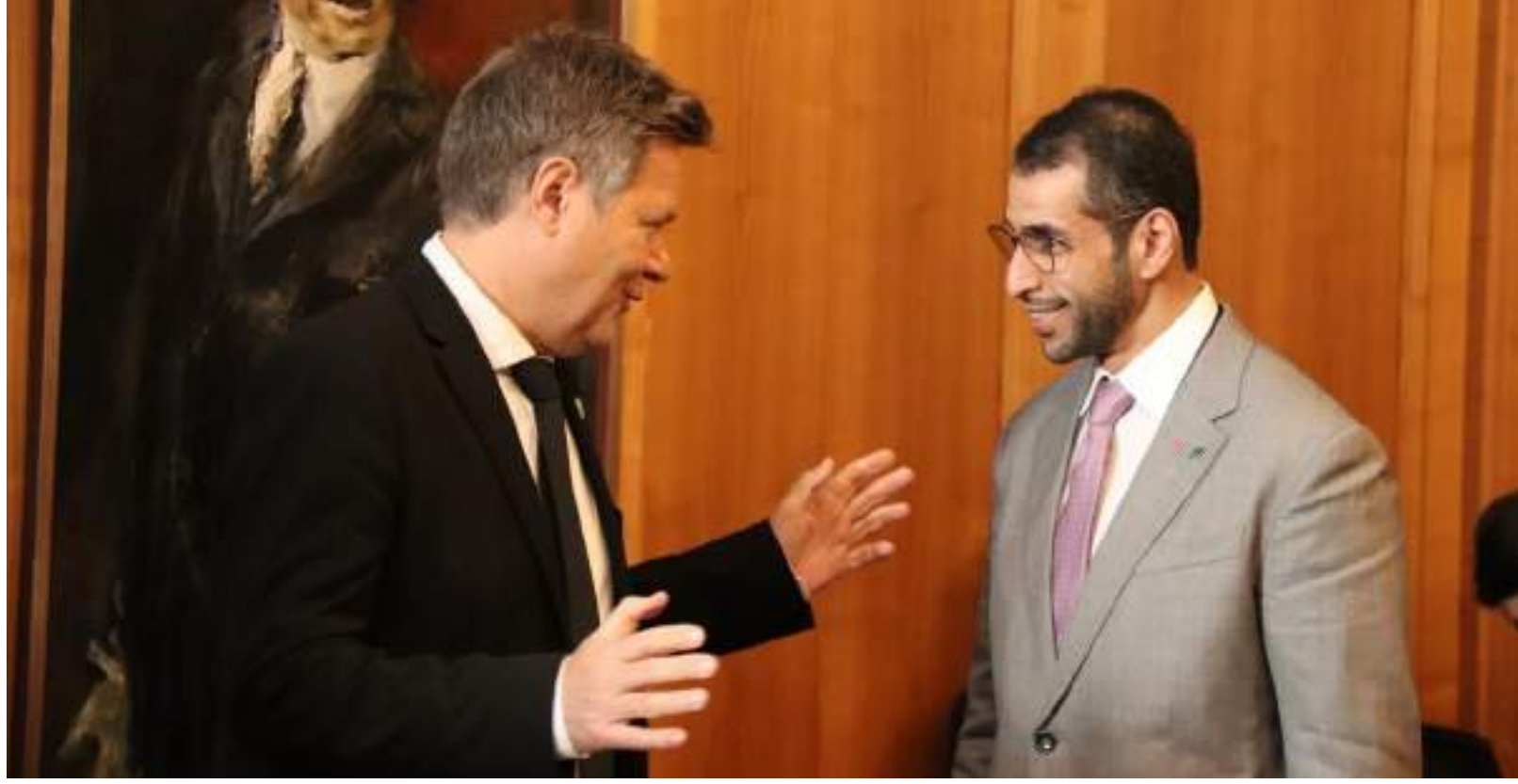
بوظبي - (وام):

اختتمت دولة الإمارات العربية المتحدة مشاركتها الناجحة في مؤتمر الأطراف «COP29» الذي احتضنته دولة أذربيجان الصديقة، حيث سلطت الضوء على التزامها المستمر بالعمل المناخي العالمي ومواصلة البناء على إرث مؤتمر الأطراف «COP28». وشهد افتتاح القمة العالمية للعمل المناخي، حضور صاحب السمو الشيخ محمد بن زايد آل نهيان رئيس الدولة «حفظه الله». وشارك وفد دولة الإمارات العربية المتحدة بشكل فاعل في مختلف أعمال المؤتمر، بما في ذلك تسليم رئاسة مؤتمر الأطراف إلى أذربيجان في اليوم الأول. والمشاركة في الجلسات