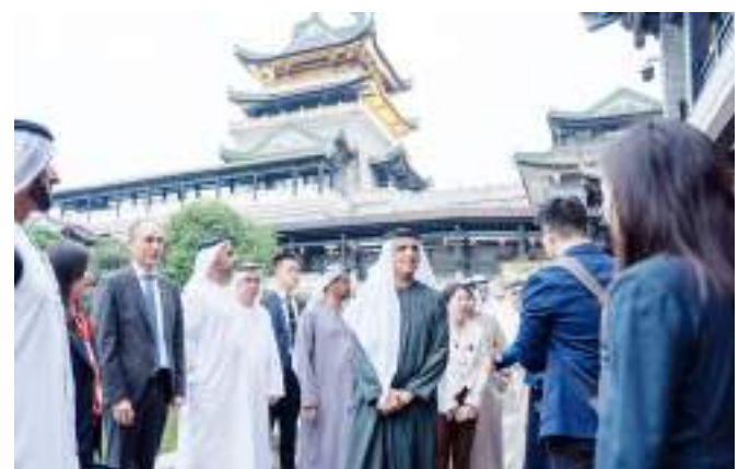
قوانغتشو - الصين-وام:

زار صاحب السمو الشيخ سعود بن صقر القاسمي، عضو المجلس الأعلى، حاكم رأس الخيمة، في إطار الزيارة التي يقوم بها سموه إلى مقاطعة قوانغدونغ في الصين، المنطقة الثقافية في قوانغتشو، وشارع «يونغ تشينغ فانغ» التاريخي. كما شهد سموه عرضاً للأوبرا «الكانتونية» التقليدية التي تشتهر بها المقاطعة الأكثر اكتظاظاً بالسكان في الصين. وقال صاحب السمو حاكم رأس الخيمة إن فهم ثقافة وتقاليد الشعوب واحترام تراثها الإنساني.