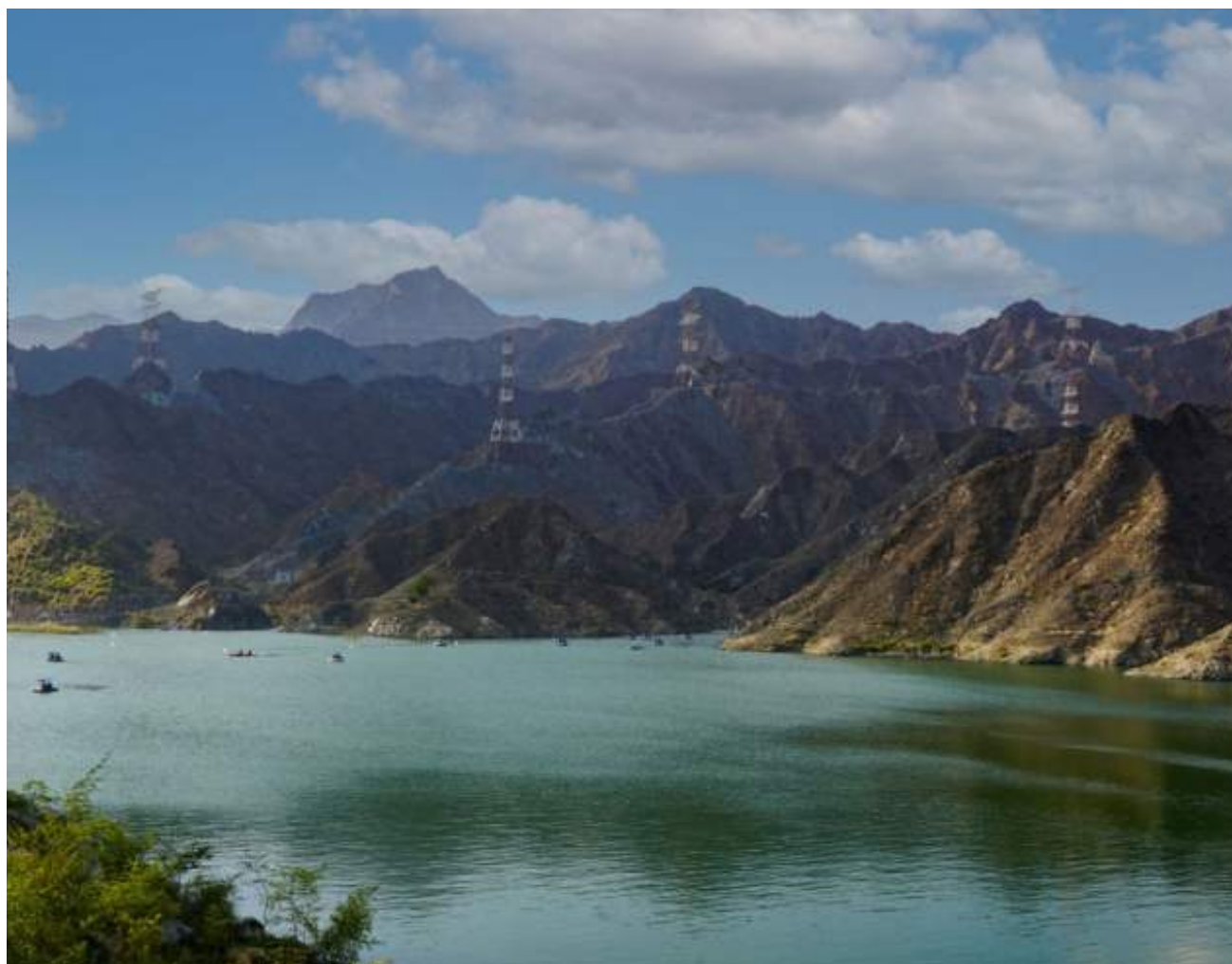
مدينة حتا قبلة سياحية يقصدها الزوار من مختلف المناطق للاستمتاع بمواقعها الطبيعية الخلابة

للاستفسارات العامة info@alwahdanews.ae الموقع الإلكتروني www.alwahdanews.ae