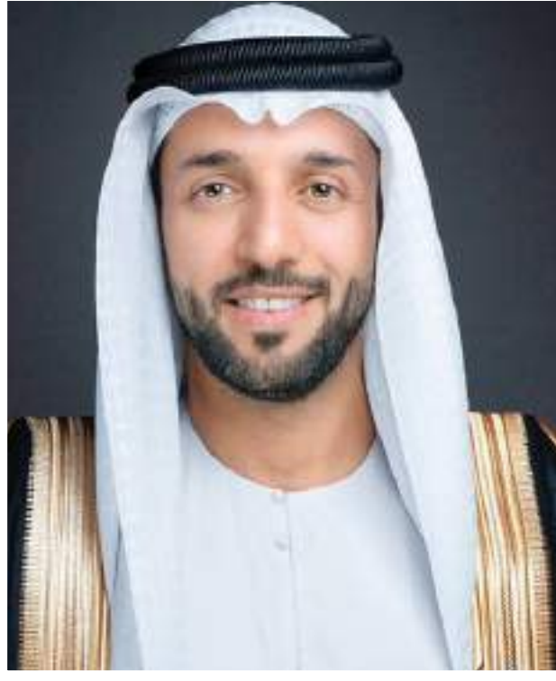
أبو ظبي - الوحدة:

- أشاد معالي الدكتور سلطان بن سيف النيادي، وزير دولة لشؤون الشباب، بالمكانة العالمية المتقدمة التي حققتها دولة الإمارات في رياضة الجوجيتسو، مشيراً إلى أن بطولة أبو ظبي العالمية لمحترفي الجوجيتسو تجسد نجاح هذه الرياضة محلياً ودولياً. وجاءت تصريحات معاليه على هامش حضوره منافسات النسخة السادسة عشرة من البطولة، التي تحتضنها أبو ظبي في الفترة من 6 إلى 16 نوفمبر الجاري. بمشاركة أكثر من 9 آلاف لاعب ولاعبة من 137 دولة. وقال معالي الدكتور النيادي: «بطولة أبو ظبي العالمية لمحترفي الجوجيتسو شهادة نجاح وتميز لرياضة الجوجيتسو في الإمارات، في ظل هذه المشاركة الكبيرة التي تعكس ثقة العالم بإمكانات الدولة والعاصمة أبو ظبي. وقد أصبحت رياضة الجوجيتسو اليوم، واحدة من أهم وأنجح رياضات الدولة بفضل دعم القيادة الرشيدة، وجهود اتحاد اللعبة للوصول بها إلى العالمية وتحقيق الريادة» وأضاف: