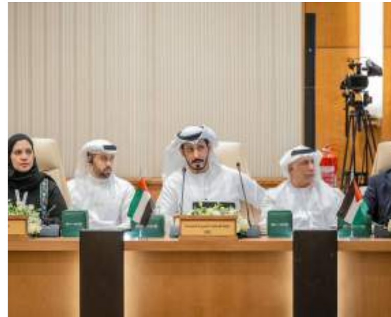
الرياض . (وام):

شارك الوفد الوطني لدولة الإمارات العربية المتحدة برئاسة الأمين العام، نائب رئيس اللجنة الوطنية لمواجهة غسل الأموال وتمويل الإرهاب وتمويل التنظيمات غير المشروعة لدولة الإمارات سعادة حامد سيف الزعابي، في الاجتماع العام الـ 39 لمجموعة العمل المالي لمنطقة الشرق الأوسط وشمال أفريقيا (MENAFATF) والذي استضافته العاصمة الرياض. شهد الاجتماع العام حضور الدول الأعضاء وخبراء في مجال مكافحة غسل الأموال وتمويل الإرهاب وتمويل انتشار التسلح وعدد من المراقبين من دول ومنظمات إقليمية ودولية، وبمشاركة السيدة اليزا ميدراسو، رئيس مجموعة العمل المالي (فاتاف)، وناقش الاجتماع العام موضوعات عدة متعلقة بمجالات عمل المجموعة الإقليمية وأنشطتها واتخذ العديد من القرارات في هذا الصدد. ومن أهمها تولي دولة الإمارات منصب نائب رئيس للمجموعة لعام 2025. وتم اعتماد ترشيح المنصب لسعادة حامد سيف الزعابي الأمين العام ونائب رئيس اللجنة الوطنية لمواجهة غسل الأموال وتمويل الإرهاب وتمويل التنظيمات غير المشروعة لدولة الإمارات وبمباركة من رئيس مجموعة العمل المالي (فاتاف)، كما تم اعتماد الأولويات المشتركة للرئاسة بين مملكة الأردن الهاشمية ودولة الإمارات العربية المتحدة في مجالات متعددة لمواصلة دعم وتحقيق