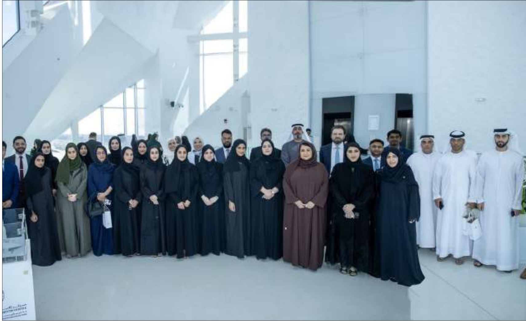
دبي.