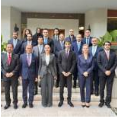
تيرانا - ألبانيا . (وام):

أطلقت دولة الإمارات العربية المتحدة وجمهورية ألبانيا لجنة اقتصادية مشتركة لاستكشاف فرص توسيع العلاقات التجارية والاستثمارية بين البلدين الصديقين في القطاعات الحيوية ذات الأولوية المشتركة. وعقدت اللجنة دورتها الأولى في العاصمة الألبانية تيرانا برئاسة معالي الدكتور ثاني بن أحمد الزيودي، وزير دولة للتجارة الخارجية، ومعالي بليندا بالوكو، نائبة رئيس الوزراء ووزيرة الطاقة والبنية التحتية في ألبانيا. بحضور سعادة جمعة محمد الكيت، الوكيل المساعد لشؤون التجارة الدولية في وزارة الاقتصاد، ومن الجانب الألباني معالي بليندي غونجيا، وزير الاقتصاد والثقافة والابتكار ونائبه معالي سوكونل دوما ومعالي إنكليدموس ايبلي، وبمشاركة ممثلي القطاع الخاص من الجانبين. وأكد معالي الدكتور ثاني الزيودي في كلمته الافتتاحية للدورة الأولى أن اللجنة الاقتصادية المشتركة بين الإمارات وألبانيا تمثل منصة إستراتيجية لدفع التعاون التجاري والاستثماري إلى مستويات جديدة تعكس الطموحات الاقتصادية للدولتين. وتسرع تنفيذ إستراتيجيتهما لتحقيق النمو المستدام. وقال إن دولة الإمارات، باتت بفضل موقعها الجغرافي وبنيتها التحتية المتقدمة وسياساتها الاقتصادية القائمة على التنوع والانفتاح التجاري، مركزاً عالمياً لتسهيل تدفقات التجارة والخدمات ولاستقطاب الاستثمارات والأعمال.