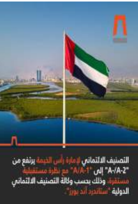
التصنيف الائتماني، إمارة رأس الخيمة يرتفع من «A-2/A» إلى «A-1/A» مع نظرة مستقبلية مستقرة، وذلك بحسب وكالة التصنيف الائتماني الدولية «ستاندرد أند بورز»

وقال المتحدث رسمي باسم حكومة رأس الخيمة، إن الإستراتيجية الاقتصادية الناجحة لرأس الخيمة ومشاريعها الطموحة والمدروسة أثرت بشكل حاسم، ما دفع وكالة «ستاندرد أند بورز» العالمية إلى رفع تصنيفها الائتماني للإمارة ومنحها نظرة مستقبلية مستقرة، كما وضعت حكومة الإمارة، تحت القيادة الرشيدة لصاحب السمو الشيخ سعود بن صقر القاسمي، عضو المجلس الأعلى، حاكم رأس الخيمة، أسساً قوية لنموذج اقتصادي متنوع وحيوي، الأمر الذي يدعم تطلعات الإمارة لتعزيز جاذبيتها باعتبارها وجهة مفضلة