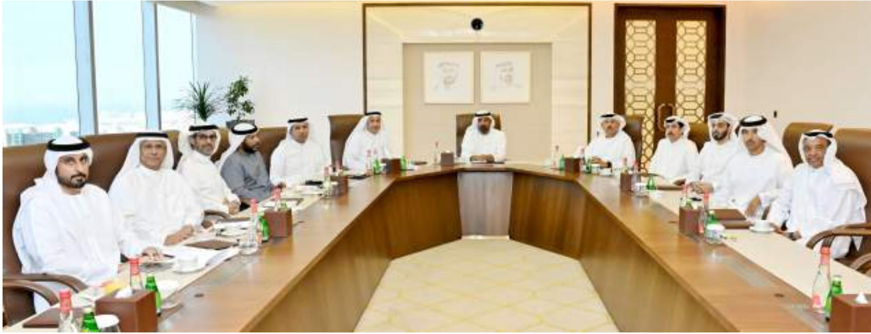
دبي . (الوحدة):

خاصة بالاستثمار الأجنبي المباشر والفرص الواعدة على مستوى المناطق الحرة في دبي. من خلال تعزيز التنافسية وجذب استثمارات الاقتصاد الجديد. وناقش المجلس المستجدات حول المناطق الاقتصادية الخاصة والتخصيص المزوج. كما بحث تعزيز التعاون بين سلطات المناطق الحرة في إمارة دبي مع هيئة الطرق والمواصلات في دبي لتعزيز السلامة المرورية في المناطق الحرة، ولتوفير مرافق بنية تحتية وشبكة نقل متطورة لسكان دبي.