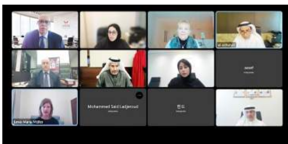
خلال منتدى حماية حقوق الإنسان

وركز المنتدى، الذي نفذته الدائرة مثله بأكاديمية أبوظبي القضائية واختتمت أعماله يوم الخميس، على دور القانون والقضاء في حماية حقوق الإنسان وتعزيز التنمية المستدامة، مع تسليط الضوء على تجربة دولة الإمارات الرائدة في تعزيز قيم العدل والمساواة، وتحديث الأطر القانونية والتشريعية وفقاً لأفضل الممارسات العالمية، وشهد المنتدى على مدار يومين، سلسلة من الجلسات تناولت عدداً من الموضوعات، أبرزها الإطار القانوني والتنظيمي في دولة الإمارات والذي يتوافق مع الإعلان العالمي لحقوق الإنسان وكافة المعاهدات والوثائق الدولية ذات الصلة، ودور القانون والقضاء في حماية الحقوق والحريات في التجربة الكندية، ودور محكمة الأسرة في تعزيز العدالة الاجتماعية، وجهود دائرة القضاء في مجال حقوق الإنسان، والتجربة الأمريكية للنيابة