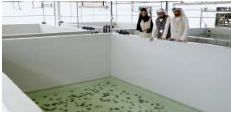
خلال تدشين المشروع