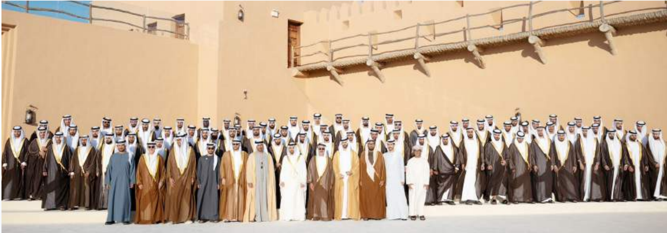
حمدان بن زايد آل نهيان خلال حضوره العرس الجماعي