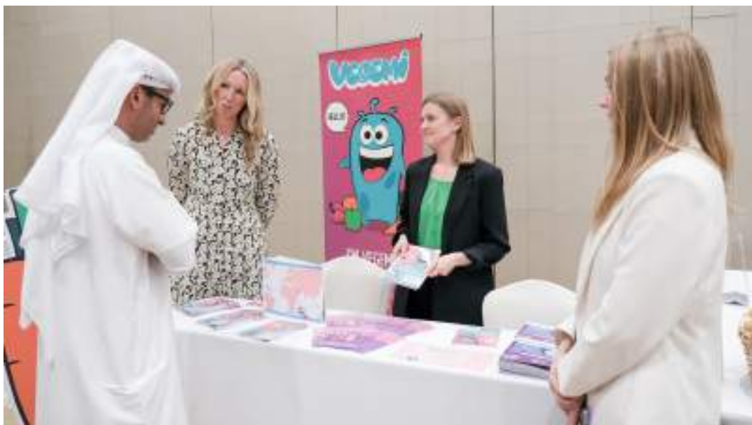
خلال منتدى صحة دبي