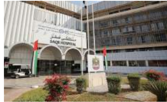
مبنى مستشفى صقر