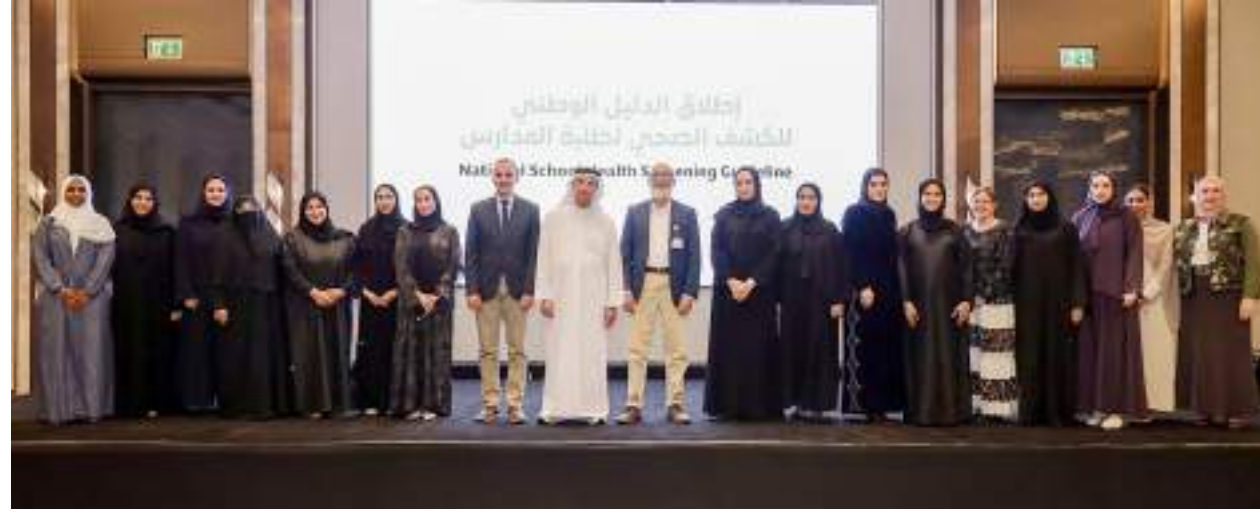
صورة جماعية بمناسبة إطلاق الدليل