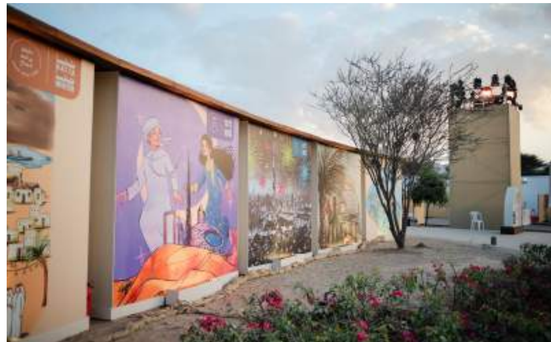
جانب من أعمال المبدعات الإماراتيات