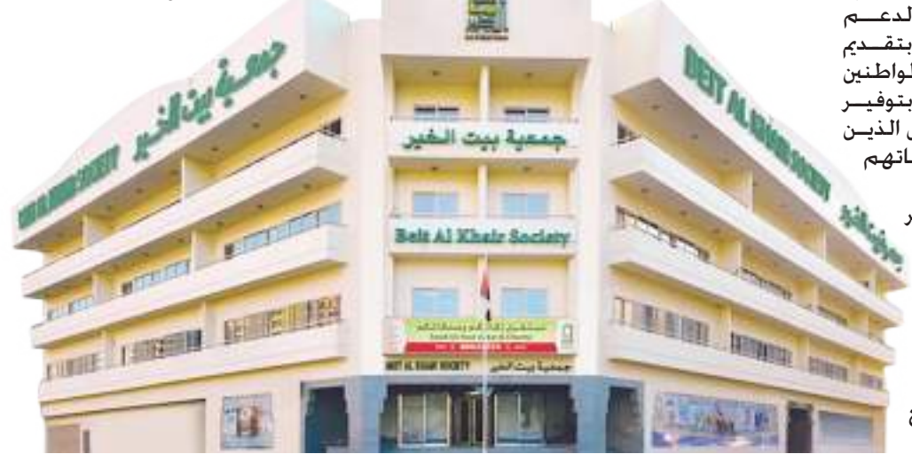
جمعية بيت الخير

مواقع التواصل الاجتماعي وهدفها جمع التبرعات وحشد الدعم للحالات الحرجة والطارئة، ومبادرة «أنقذ قلباً» بالتعاون مع «دبي الصحية الأكاديمية» ممثلة بمؤسسة الجليلة لإنقاذ المرضى المصابين بذبحة صدرية تهدد حياتهم، وكذلك مبادرة «أفرحهم» مع مجموعة زليخة الطبية بهدف توفير العلاج الطبي الأساسي للمرضى المحتاجين.