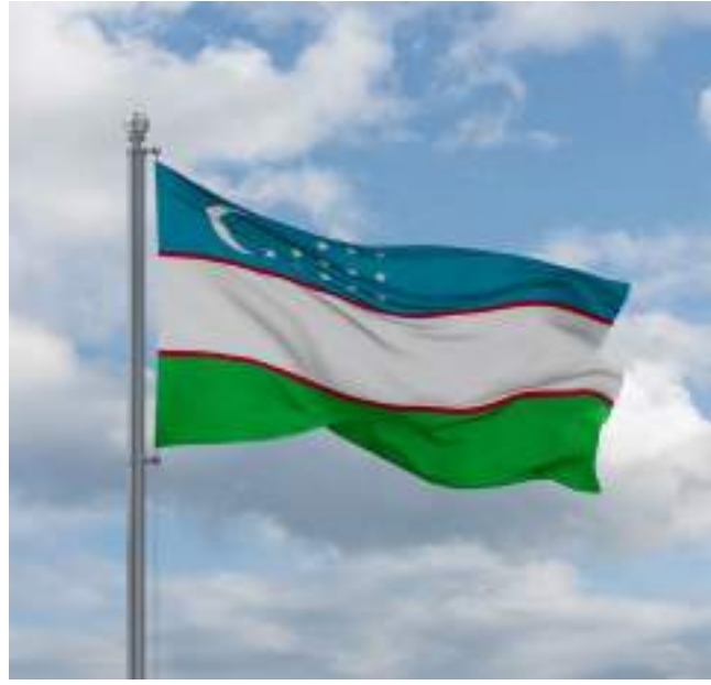
طشقند . (وام):

بنسبة 9.8% سنوياً، وهي أقل زيادة سنوية منذ ثمانية أشهر، وزادت الأسعار بنسبة 1.04% شهرياً، وسجلت أسعار الغذاء في أوزبكستان الشهر الماضي ارتفاعاً بنسبة 1.8% شهرياً وبنسبة 2.4% سنوياً، في حين زادت أسعار السلع غير الغذائية بنسبة 0.4% شهرياً و7.7% سنوياً، بحسب وكالة بلومبرج للأنباء.