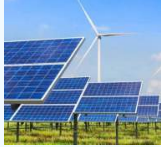
أبوظبي . (الوحدة):

تقود دولة الإمارات، تبني مفهوم المدن المستدامة من خلال مجموعة من المشاريع التكنولوجية، مثل مدينة «مصدر»، وهي مركزاً زائد الدولي، الذي يقوم على بنية ختية ذكية تعمل على تعزيز الكفاءة.