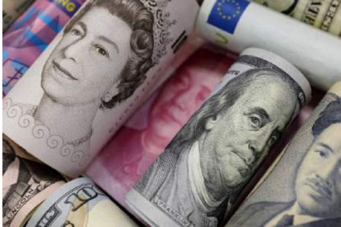
نيويورك . (وكالات):

بدأ الدولار العام الجديد قوياً بعد مكاسب على مدار 2024 أمام معظم العملات في حين تراجع الين إلى أدنى مستوياته في أكثر من 5 أشهر مع توقعات بإبقاء الفائدة الأمريكية مرتفعة لفترة أطول.