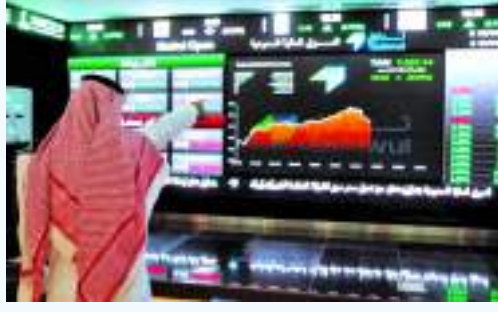
الرياض . (وكالات):

ارتفع مؤشر الأسهم السعودية الرئيسية «تاسي»، الخميس، بمقدار 25.24 نقطة، وبنسبة 0.21 في المائة ليصل عند مستوى 12102.55 نقطة، وبسيولة قيمتها 5.5 مليار ريال (1.4 مليار دولار).