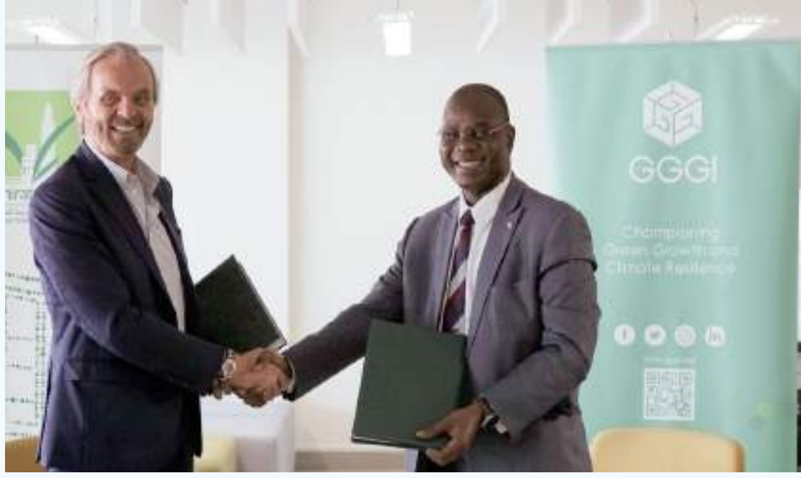
دبي . (وام):

وقع مجلس الإمارات للأبنية الخضراء، والمعهد العالمي للنمو الأخضر، مذكرة للتعاون في تعزيز التنمية الحضرية المستدامة والشاملة والخضراء والمقاومة للتغير المناخي في دولة الإمارات، من خلال مجموعة من آليات الدعم والتدريب ومنصات المعرفة وفعاليات تبادلها، والاستفادة من رؤى القطاعين العام والخاص، في معالجة التحديات التي تعيق