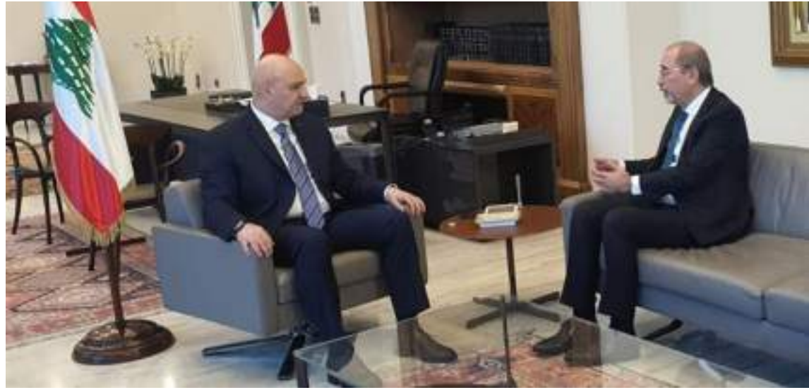
عمان ابيروت ( د ب أ ) -

وليد عبد الرحمن جفال الجديد ونقل الوزير الصفدي . خلال اللقاء ، إلى الرئيس عون «تهاني العاهل الأردني وتأييده له بالتوفيق في مسؤولياته الوطنية الجديدة وسلمه رسالة خطية». وقال العاهل الأردني ، في الرسالة ، «إنني إذ أعبر لكم عن بالغ الاعتزاز بعلاقات الاخوة المتينة التي تربط بين بلدينا، لاؤكدهم الحرص على المضي قدما في توطيدها وتعزيزها في شتى الميادين». وأضاف: «وحرصا منا على الارتقاء بالعلاقات الثنائية، فإنه يسرنا أن نوجه الدعوة لفاخمتكم، لزيارة العام، وفي الوقت الذي ترونه مناسباً، إذ أن هذه الزيارة ستشكل فرصة للتهنؤ بمسئوليات التعاون بين بلدينا، وبحث مختلف القضايا ذات الاهتمام المشترك». وحمل الرئيس عون الوزير الصفدي « فشكره إلى العاهل الأردني على التهنئة والدعوة، وأعدا بتلبيتها بعد تشكيل الحكومة الجديدة». وتناول البحث العلاقات الثنائية بين البلدين وسبل تطويرها والدعم الذي يقدمه الأردن للبنان في المجالات كافة ، وتطرق البحث إلى الأوضاع في غزة بعد الإعلان عن الاتفاق الجديد. وقال الوزير الصفدي في تصريح للصحفيين «موقفاً في المملكة هو أننا نقف إلى جانب امن لبنان واستقراره وسيادته .