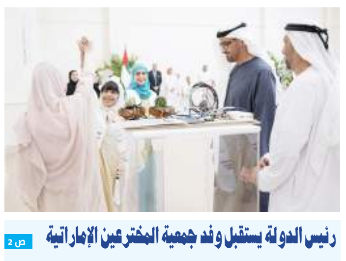
رئيس الدولة يستقبل وفد جمعية المخترعين الإماراتية

تنفيذ «حل الدولتين» السبيل لتحقيق الاستقرار بالمنطقة أكد أهمية بدء عملية سياسية شاملة تضم جميع السوريين