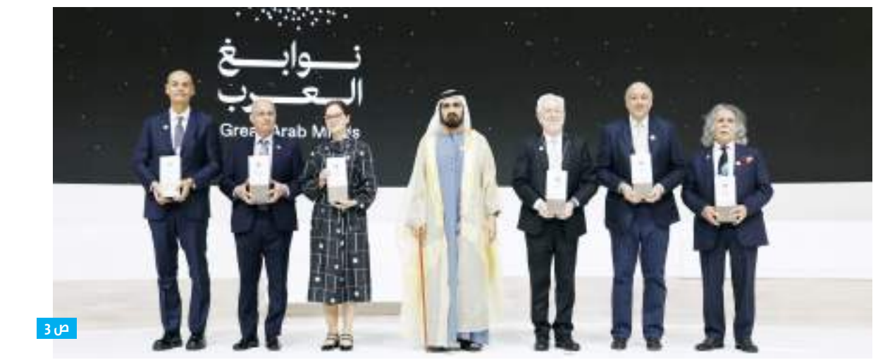
الإمارات توزع كسوة الشتاء على 2415 مستفيداً في ألبانيا

أبو ظبي-وام: واصلت هيئة الهلال الأحمر الإماراتي جهودها الإنسانية والإغاثية من خلال توزيع كسوة الشتاء في عدد من الدول الشقيقة والصديقة، بهدف التخفيف من تداعيات فصل الشتاء على المتأثرين بموجات البرد القارس، الذين يعيشون في ظروف مناخية صعبة ومعقدة. وأكدت الهيئة أن خطتها تركز على توسيع نطاق المستفيدين من هذه المساعدات الشتوية على مختلف الأصعدة. وفي هذا الإطار، قام مكتب الهيئة في جمهورية ألبانيا ص | 8 |