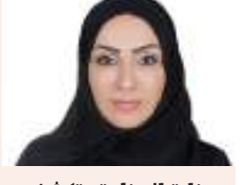
«وزارة الصناعة» تكشف عن مشروع لإعادة تدوير الإطارات المستعملة