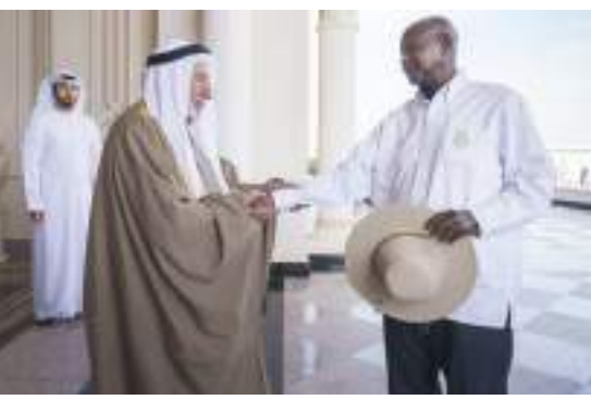
حاكم الشارقة يستقبل رئيس أوغندا

أبو ظبي-وام: بحث صاحب السمو الشيخ محمد بن زايد آل نهيان رئيس الدولة «حفظه الله» مع أخيه فخامة عبدالفتاح السيسي رئيس جمهورية مصر العربية الشقيقة، يوم الخميس، العلاقات الأخوية وجوانب التعاون والعمل المشترك بين البلدين وسبل تنميته في جميع المجالات خاصة التنمية والاقتصادية والاستثمارية بما يخدم مصالحهما المشتركة ويحقق تطلعات شعبيهما إلى التنمية والازدهار. كما استعرض سموه وفخامة الرئيس عبدالفتاح السيسي. ملتحج 2