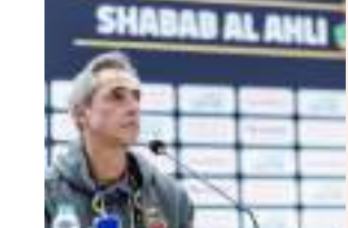
مدرب شباب الأهلي: التفاصيل تحسم درع التحدي مع الريان اليوم