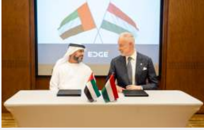
أبوظبي / الوحدة/

وقال سعادة الدكتور علي بن تميم رئيس مركز أبوظبي للغة العربية إن برنامج المنح البحثية يعزز توجه المركز نحو بناء قاعدة بحوث ودراسات عربية منضبطة، وتطوير البحث العلمي باللغة العربية وتوسيع آفاقه مع التركيز على عناصر الجودة والابتكار والتفرد.