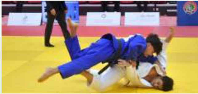
أبو ظبي . (وام):

اعتمد اتحاد الإمارات للجودو، إقامة بطولتي أبطال الإمارات للرجال والشباب للجودو على صالة نادي كلباء الرياضي السيت المقبل. وكشف الاتحاد يوم الأربعاء عن بدء إجراءات الميزان الرسمي للمشاركين في البطولتين بعد غد الجمعة. بصالتي نادي كلباء الرياضي والشاركة لرياضات الدفاع عن النفس تمهيدا لاعتماد القوائم النهائية بعد إغلاق باب التسجيل عبر موقع الاتحاد الرسمي. وحددت اللائحة الفنية للبطولة، المشاركة المفتوحة للمواطنين في كل وزن من أوزان المنافسات. بينما سمحت بمشاركة لاعب واحد للمقيمين في كل وزن فيما تم تحديد 8 أوزان لفئة الشباب « تحت 55 كجم. وحتى فوق 100 كجم». بينما تبدأ أوزان الشباب من «وزن تحت 44 كجم. وحتى فوق 78 كجم».