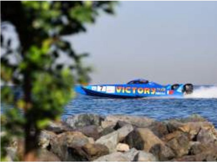
دبي - الوحدة: