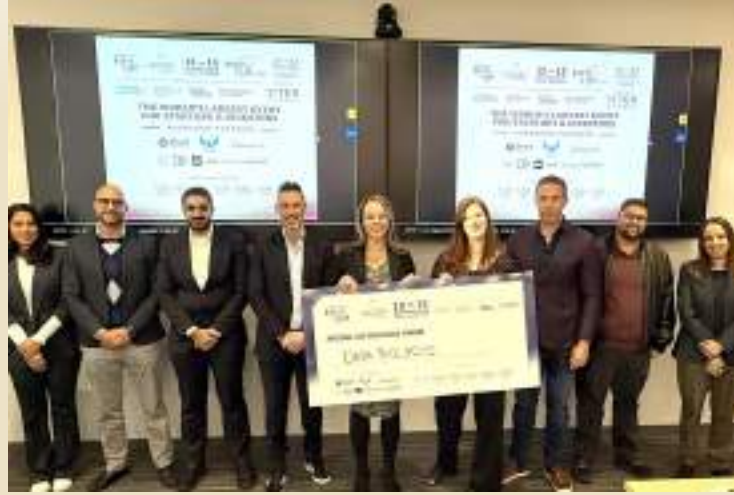
دبي • (الوهدة):

نظّمت غرفة دبي للاقتصاد الرقمي، إحدى الغرف الثلاث العاملة تحت مظلة غرف دبي، ومركز دبي التجاري العالمي، أولى الحملات الترويجية الدولية لمعرض «إكسباند نورث ستار 2025»، الذي يعدّ أكبر فعالية للشركات الناشئة والمستثمرين حول العالم، والذي ينظمه مركز دبي التجاري العالمي، وتنتضيف الغرفة دورته المقبلة في دبي هاربر خلال الفترة من 12 وحتى 15 أكتوبر من العام الجاري.