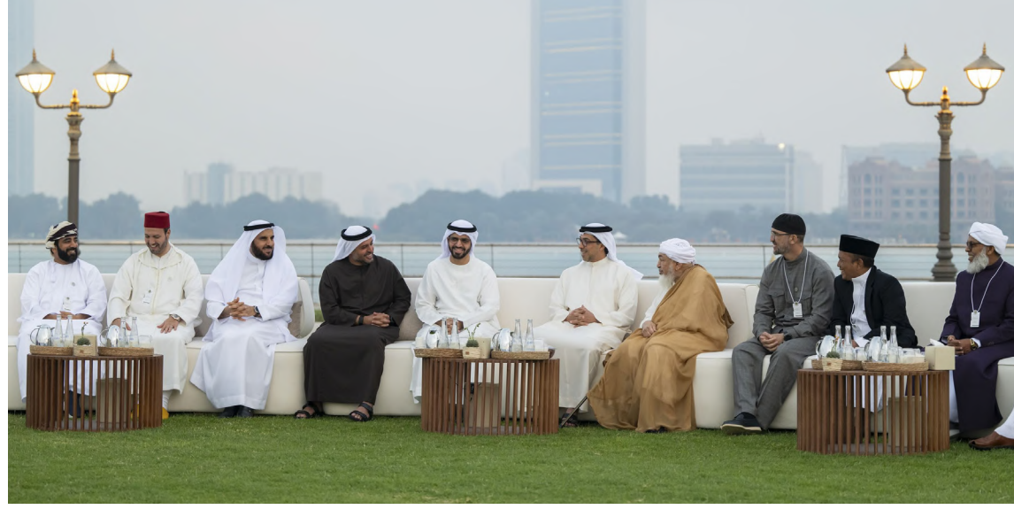
أبوظبي - وام:

وبركة على دولة الإمارات قيادةً وشعباً. كما تبادل سموه والحضور الأحاديث الودية حول أهمية تعزيز قيم التواصل والتراحم خلال الشهر الفضيل. وأشاد العلماء والحضور «برنامج ضيوف رئيس الدولة» الذي تستضيف خلاله الهيئة العامة للشؤون الإسلامية والأوقاف والزكاة ومجلس الإمارات للإفتاء الشرعي والعلماء من ضيوف صاحب السمو رئيس الدولة «حفظه الله» ومجلس التوازن.. مأدبة الإفطار الرمضاني التي أقيمت في «فندق قصر الإمارات» في أبوظبي.