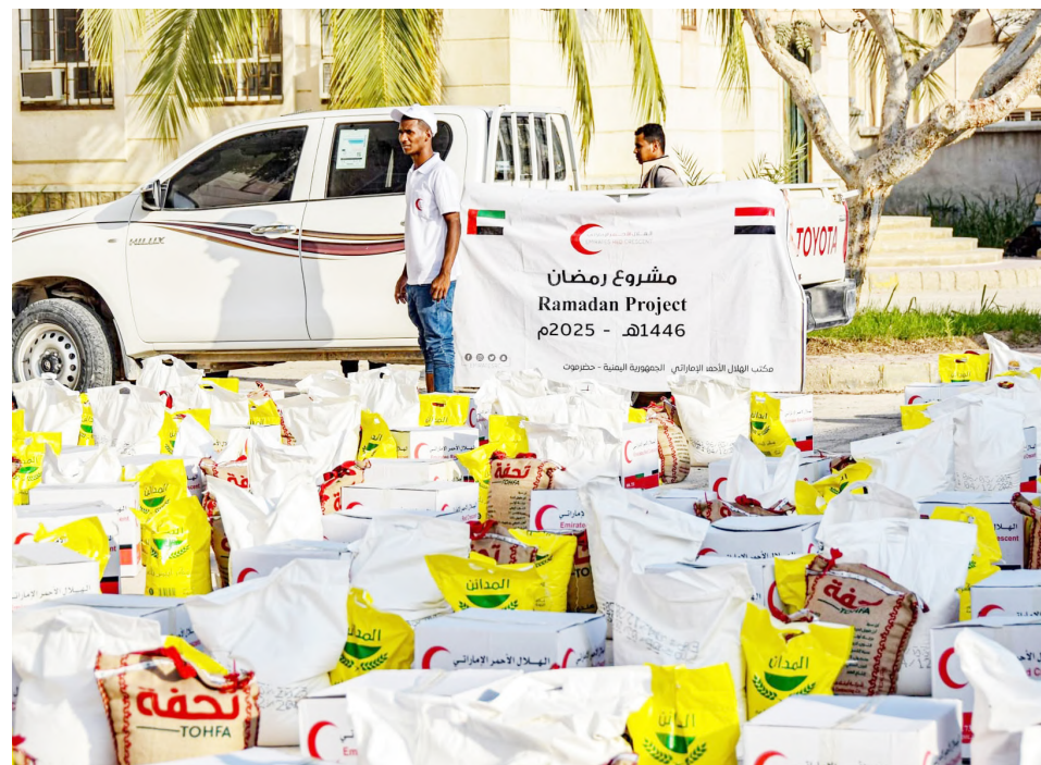
المكلا - وام:

تواصل هيئة الهلال الأحمر الإماراتي تنفيذ مشروعاتها الإنسانية والإغاثية في محافظة حضر موت خلال شهر رمضان المبارك من خلا تقديم الدعم للأسر المحتاجة وتعزيز قيم التعاون والتكافل بين أفراد المجتمع وذلك في إطار الجهود المستمرة للهيئة لدعم الفئات الأكثر احتياجاً وتعزيز الأمان الغذائي خلال الشهر الفضيل.