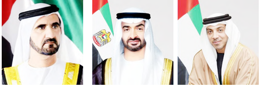
أبو ظبي - وام:

بعث صاحب السمو الشيخ محمد بن زايد آل نهيان رئيس الدولة «حفظه الله» برقية تعزية إلى أخيه خادم الحرمين الشريفين الملك سلمان بن عبد العزيز آل سعود. ملك المملكة العربية السعودية الشقيقة. عبر فيها عن خالص تعازيه وصادق مواساته بوفاة صاحبة السمو الأميرة نورة بنت بندر بن محمد آل عبدالرحمن آل سعود.