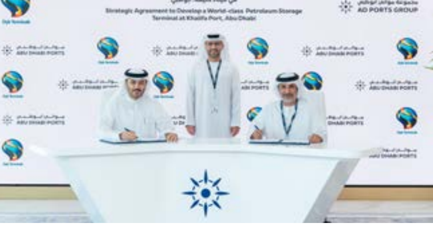
أبو ظبي . (الوحدة):

لقطاع الموانئ - مجموعة موانئ أبو ظبي، عن فخره باحتضان المجموعة لشركة أويلز تيرمينالز في ميناء خليفة من خلال هذه الاتفاقية التي تؤكد الأهمية الإستراتيجية فقط لدولة الإمارات العربية المتحدة، بل للمنطقة بأكملها. متطلعاً من خلال هذه الاتفاقية إلى تأسيس شراكة طويلة ومثمرة مع أويلز تيرمينالز. بما يساهم في تعزيز قدرات ميناء خليفة عبر محطة تخزين السوائل، وجذب المزيد من المتعاملين الباحثين عن بنية تحتية عالمية المستوى، وتسهيل الوصول إلى الأسواق العالمية. من جانبه، قال الدكتور خالد عمر محمد حمد المدفع، رئيس مجلس إدارة شركة «أويلز تيرمينالز»، إن هذا المشروع الرائد يعكس التزام الشركة بتطوير بنية تحتية متطورة، ستساهم في تعزيز مكانة أبو ظبي مركزاً عالمياً للطاقة.