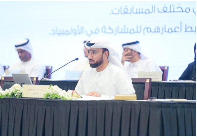
دبي . (وام):

أكد سعادة فارس محمد المطوع، الأمين العام للجنة الأولمبية الوطنية أن اختيار سمو الشيخ منصور بن محمد بن راشد آل مكتوم رئيساً للجنة الأولمبية الوطنية في دولة الإمارات للفترة الأولمبية 2024 - 2028، خطوة مهمة تصب في مصلحة الحركة الرياضية.