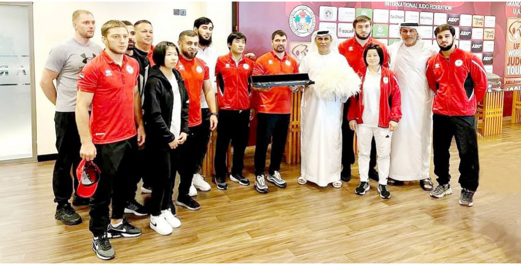
أبو ظبي . (الوحدة):

للدعم والاهتمام من القيادة الرشيدة، واستكمالاً للجهود الملموسة والكبيرة في الدورة الماضية من قبل سمو الشيخ أحمد بن محمد بن راشد آل مكتوم، النائب الثاني لحاكم دبي، وأشار إلى أن اتحاد الجودو شريكاً إستراتيجياً فاعلاً، من خلال مشاركته الإيجابية، وتواجده منذ سنوات عدة في مختلف الدورات الأولمبية، وحرصه المستمر على مواكبة التطور، والتعاون المستدام مع اللجنة الأولمبية في جميع المجالات التي تعزز مكانة دولة الإمارات عالمياً.