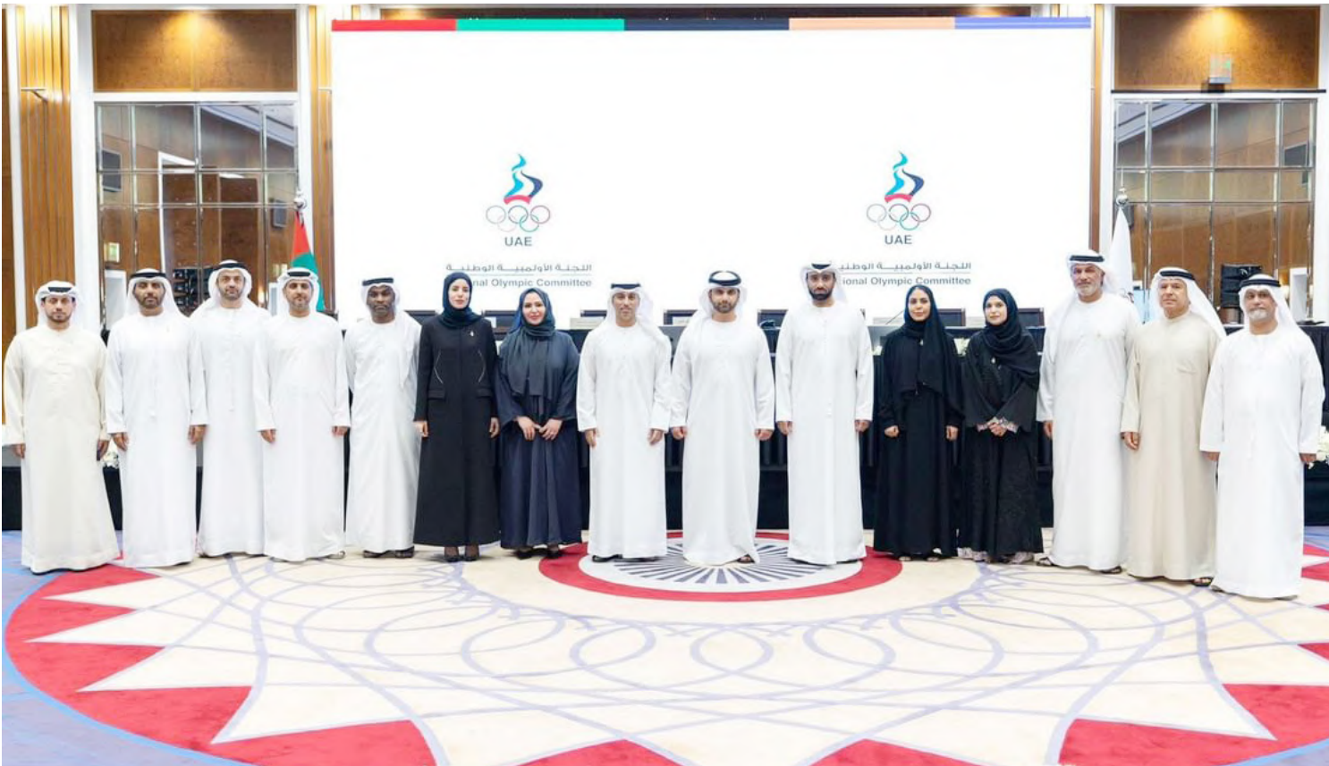
أبو ظبي . (وام):

أكد مسؤولون في المجالس والاتحادات الرياضية أن اعتماد الاجتماع العادي للجمعية العمومية للجنة الأولمبية الوطنية اليوم في دبي انتخاب سمو الشيخ منصور بن محمد بن راشد آل مكتوم رئيساً للجنة الأولمبية الوطنية، خطوة إستراتيجية تساهم في استدامة تطور الرياضة الإماراتية.