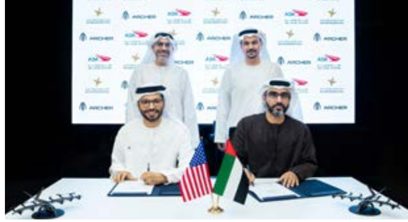
أبو ظبي . (وام):

في قطاع الطيران على مستوى المنطقة وأكبر مشغل للطائرات المروحية في الشرق الأوسط. فإننا نتمتع بالخبرات اللازمة لتطوير خدمات نقل جوي حضرية قابلة للتوسع. كما أننا نتطلع إلى الريادة في إطلاق خدمات التاكسي الطائر في المنطقة. بدءاً من أبو ظبي». من جانبه، قال آدم غولدستين، المؤسس والرئيس التنفيذي لشركة «آرتشر للطيران»، إن الكشف عن الإصدار الأولي من طائرات «ميدنايت»، يمثل بداية فصل جديد لشركة آرتشر. وستشكل هذه الشراكة نموذج عمل يمكن الشركة من نشر طائراتها وتوسيع عملياتها عالمياً.