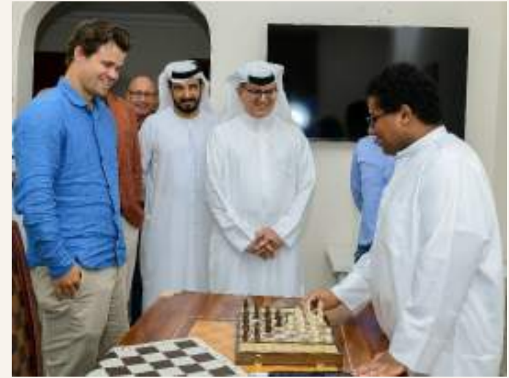
أبو ظبي . (وام):

أعلن نادي أبو ظبي للشطرنج والألعاب الذهنية المشاركة في 9 بطولات وفعاليات مختلفة خلال شهر رمضان. ضمن استراتيجيته لتطوير قدرات اللاعبين واللاعبات، والارتقاء بخبراتهم التنافسية. تتضمن تلك المشاركات بطولة الشطرنج الخاطف الرمضانية للاعبين الشباب فئة 18 سنة، والناشئين فئة 14 سنة، والفئة المفتوحة بأبو ظبي من 4 إلى 8 مارس الجاري و بطولة الشطرنج الخاطف للناشئين في «إرث أبو ظبي»، يوم 9 مارس. تعقبها مشاركة أخرى في مسابقة الشطرنج للسيدات، والرجال في الألعاب الحكومية الرياضية يومي 11، و12 مارس.