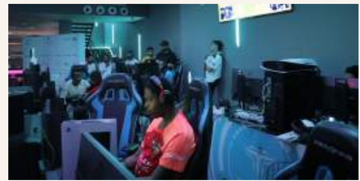
دبي . (وام):

أطلق اتحاد الإمارات للرياضات الإلكترونية، مساء الأحد الماضي، منافسات النسخة الثانية من الدوري الإماراتي لكرة القدم الإلكترونية بمشاركة 210 لاعباً من 16 نادياً من مختلف أندية الدولة، حيث بدأت المنافسات بمرحلة التصفيات، قبل انطلاق مرحلة المجموعات.