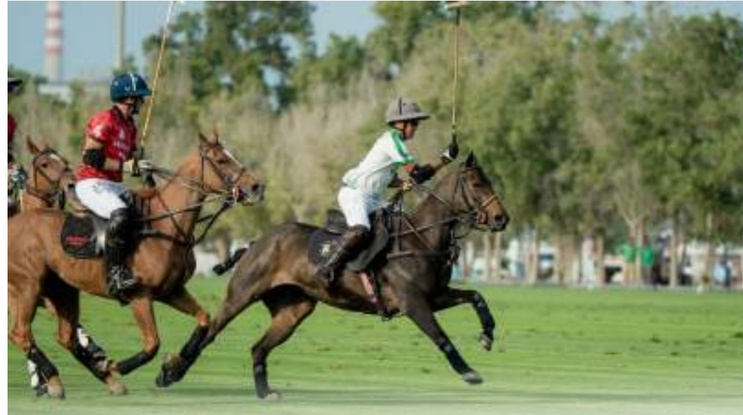
أبو ظبي . (الوحدة):

ويتطلع الفريقان لتعزيز فرص بلوغ المباراة النهائية بعد حصد نقطتين لكل منهما. إذ يكفي الفوز لحسم التأهل ومواجهة فريق غنتوت في النهائي المقرر السبت المقبل فيما تقام بعد غد الأربعاء المباراة الأخيرة في الدور التمهيدي بين فريق غنتوت وأبو ظبي.